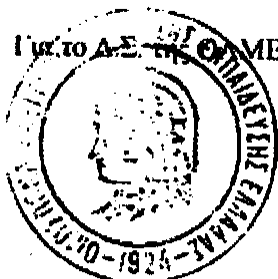
Ελένη Ζωγραφάκη – Τελεμέ