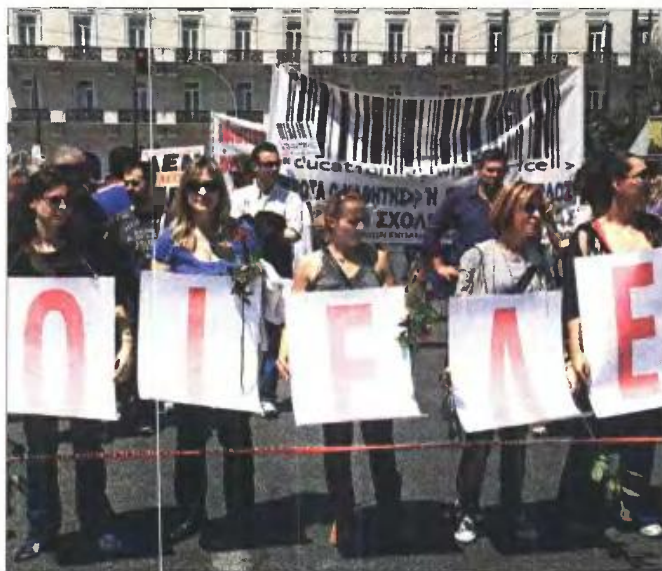
» Με κινητοποιήσεις από το φθινόπωρο, προειδοποιούν οι εκπαιδευτικοί

Από την πλευρά της, η Ομοσπονδία Ιδιωτικών Εκπαιδευτι-