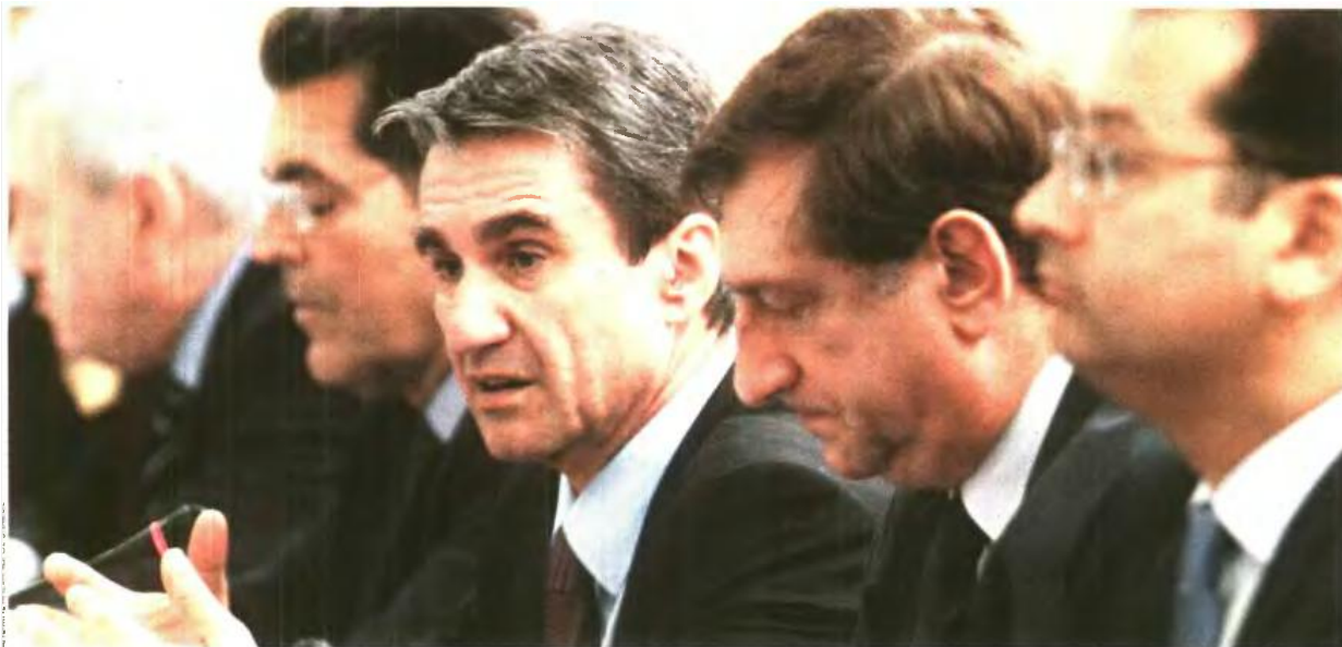
Ο υπουργός Παιδείας και Θρησκευμάτων Ανδρέας Λοβέρδος (στο κέντρο της φωτογραφίας) σε παλαιότερη συνεδρίαση της ολομέλειας του Εθνικού Συμβουλίου Παιδείας. Σήμερα, συζητείται η πρότασή του να αναλάβουν τα πανεπιστήμια και τα ΤΕΙ τον καθορισμό του αριθμού των εισακτέων

ΠΡΟΕΔΡΟΣ ΟΛΜΕ «Νέα μείωση των δαπανών για την Παιδεία το 2015»