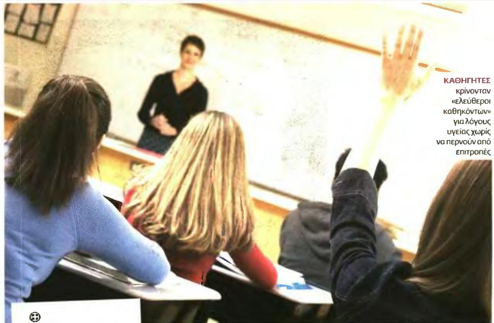
ΚΑΘΗΓΗΤΕΣ κρίνονται «ελεύθεροι καθηκόντων» για λόγους υγείας χωρίς να περνούν από επιτροπές