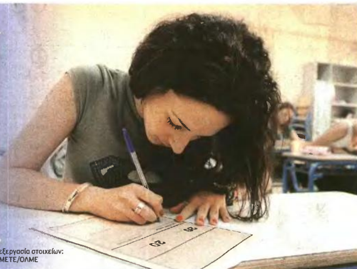
Επεξεργασία στοιχείων: ΚΕΜΕΤΕ/ΟΛΜΕ