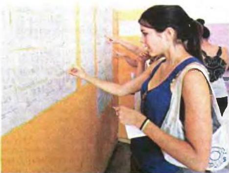
Ανωγία τάσας για τις βάσεις