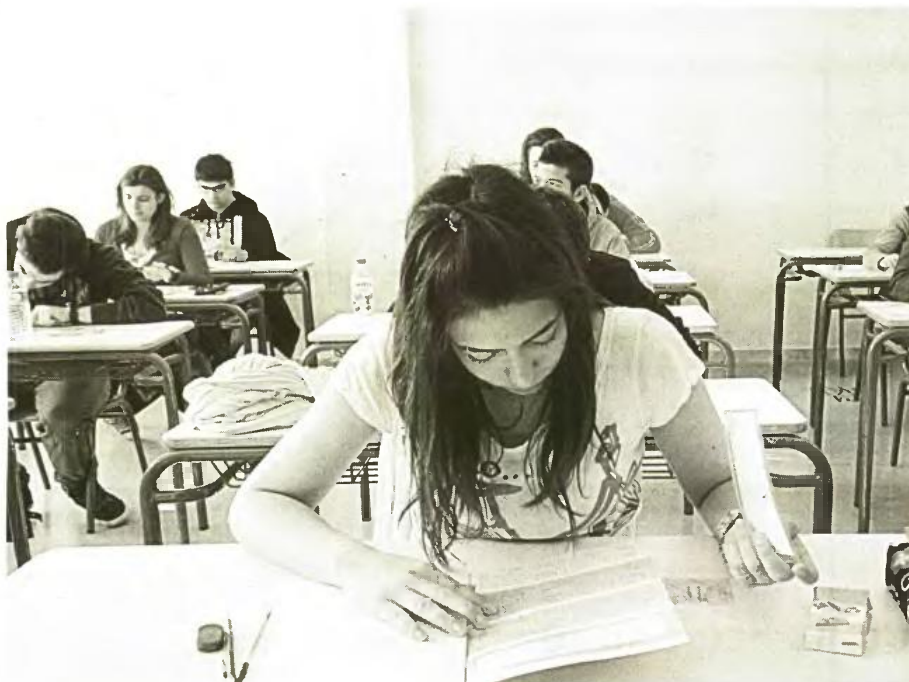
Τα στοιχεία καθηγητών της Αττικής έδειξαν ότι περίπου 15.000 μαθητές θα κληθούν να δώσουν ξανά τον Σεπτέμβριο, καθώς δεν εξασφάλισαν το πολυπόθητο «δεκάρι» για τα βασικά μαθήματα. Τώρα αναμένεται ότι θα μειωθούν

Τελικά, με νεότερη ανακοίνωση, το υπουργείο Παιδείας απέδωσε σε τεχνικό λάθος το πρόβλημα με τη χαμηλή βαθμολόγηση των γραπτών της Α' Λυκείου. Το λάθος, όπως αναφέρεται, εντοπίστηκε στον αλγόριθμο που