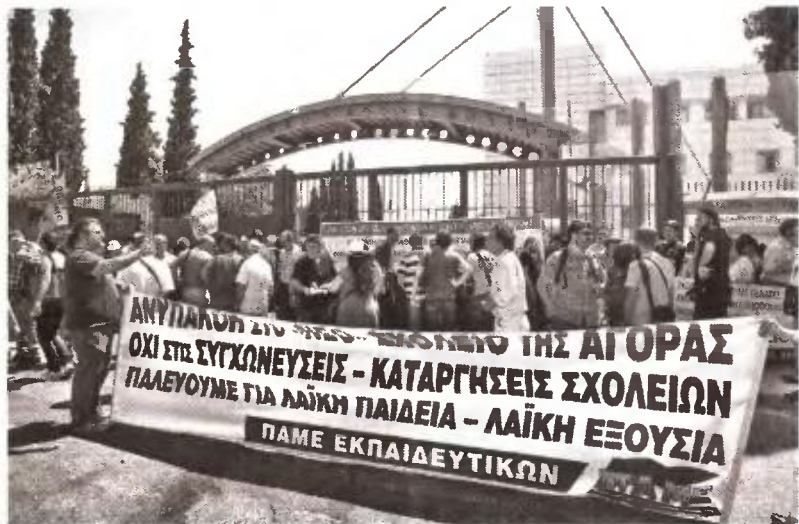
Από τη χτεςινή κινητοποίηση

Στη συνάντησή της με τον υφυπουργό Παιδείας Σ. Κεδικόγλου, αντιπρο-