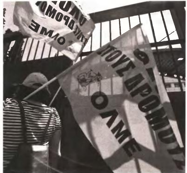
Παράσταση διαμαρτυρίας κατά της Τράπεζας Θεμάτων πραγματοποιήσε χθες στο υπουργείο Παιδείας η ΟΛΜΕ

Το υπόλοιπο 50% των θεμάτων στα οποία θα εξεταστούν οι μαθητές θα επιλεγούν από τους διδάσκοντες εκπαιδευτικούς, που θα διορθώσουν