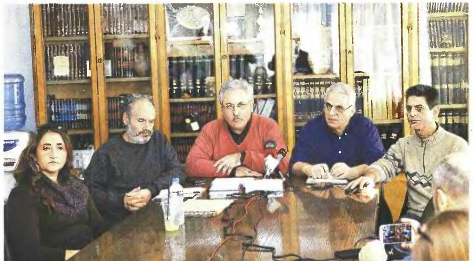
Συνέντευξη Τύπου έδωσαν στην Αθήνα εκπρόσωποι της ΟΛΜΕ και της ΠΟΕ-ΟΤΑ

Στο μεταξύ, σήμερα, στις 12 το μεσημέρι, εκπρόσωποι της Α' ΕΛΜΕ και άλλων τοπικών ενώσεων εκπαιδευτικών θα προχωρήσουν σε παράσταση διαμαρτυρίας στο υπουργείο Μακεδονίας - Θράκης, διεκδικώντας ένα δωρεάν γεύμα για κάθε παιδί στο σχολείο, πλήρη ιατροφαρμακευτική πε-