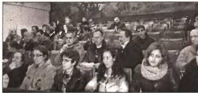
Την ερχόμενη Τρίτη 25 Φεβρουαρίου θα πραγματοποιηθεί γενική συνέλευση της ΕΛΜΕ Τρικάλων