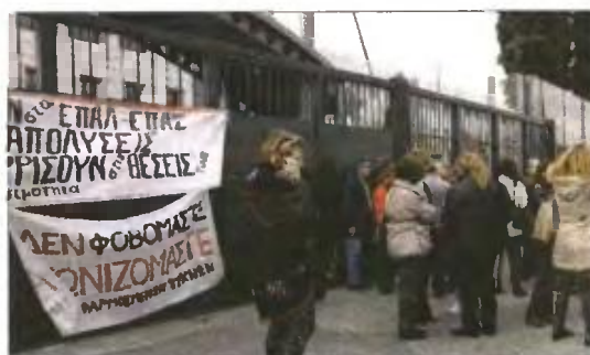
Εκπαιδευτικοί της ΟΛΜΕ έξω από το υπουργείο Παιδείας