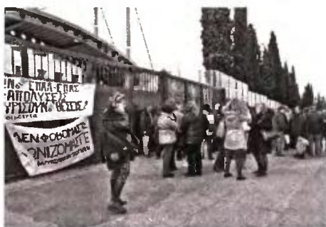
Από τη χτεσινή κινητοποίηση

Σύμφωνα με εκπροσώπους των εκπαιδευτικών, κατά τη συνάντηση, ο υπουργός εξήγγειλε ότι άμεσα θα προκηρυχθούν 380 θέσεις για την απορρόφηση αντίστοιχου αριθμού εκπαιδευτικών που είναι σε διαθεσιμότητα. Πρόκειται για 180 με δεύτερα πτυχία που θα απορροφηθούν στο υπουργείο Παιδείας και για 200 ειδικοτήτων νοσηλευτικής - μαιευτικής που θα κατευθυνθούν στο υπουργείο Υγείας. Για το θέμα, πάντως, παρέπεμψε στο υπουργείο Διοικητικής Μεταρρύθμισης και στη