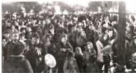
Στιγμιότυπο από τη συναυλία στον Πειραιά

Μουσική διαμαρτυρία για τα προβλήματα που πνίγουν τα ΕΠΑΛ, για τις πραγματικές ανάγκες των μαθητών τους διοργάνωσε το απόγευμα της περασμένης Παρασκευής, στην πλατεία Κοραή του Πειραιά, το Συντονιστικό ΕΠΑΛ Αττικής .