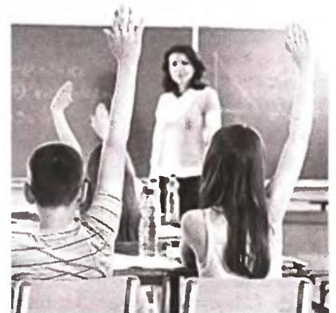
Σε μια εποχή που οι μαθητές λιποθυμούν από αστία, ποια παιδιά και ποιοι γονείς έχουν τη δυνατότητα για χειμερινές διακοπές και σκι;

Η πρόταση δεν συνάντησε καν την πλήρη αποδοχή του τουριστικού κλάδου. Για μέτρο χωρίς αποτέλεσμα έκαναν λόγο οι ξενοδόχοι των νησιωτικών περιοχών όπως η Κρήτη που, προφανώς, δεν είχαν να ωφεληθούν από την εφαρμογή του μέτρου αλλά δεν ήταν και λίγοι εκείνοι από τον τουριστικό κλάδο που αναγνώρισαν ότι το πρόβλημα δεν είναι η απουσία