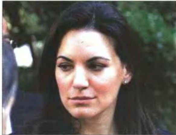
Η υπουργός Τουρισμού Ολγα Κεφαλογιάννη