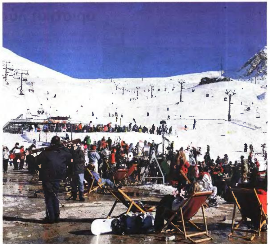
Διευκολύνσεις για τις οικογένειες που θα επιλέξουν να κάνουν τις διακοπές τους σε κάποιο ελληνικό χειμερινό προορισμό θα προτείνει το υπ. Παιδείας.

Η Πανελλήνια Ομοσπονδία Ξενοδόχων κοινοποίησε τη Δευτέρα μια ολοκληρωμένη πρόταση με στόχο την ενίσχυση της αγοράς εσωτερικού τουρισμού και κατά προέκταση των τοπικών κοινωνιών. Το Μέγαρο Μαξίμου αλλά και το υπουργείο Τουρισμού είδαν θετικά αυτή την πρόταση, ενώ από την πλευρά του το Παιδείας συμφώνησε ότι ως