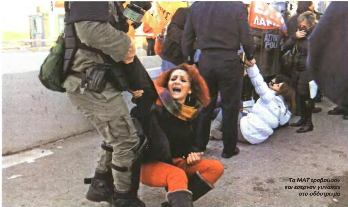
Τα ΜΑΤ τραβούσαν και έσερναν γυναίκες στο οδόστρωμα

ΜΟΙΡΑΖΑΝ ΚΛΟΤΣΙΕΣ ΚΑΙ ΧΗΜΙΚΑ ΣΤΗ ΔΙΑΔΗΛΩΣΗ ΣΤΑ ΤΕΜΠΗ