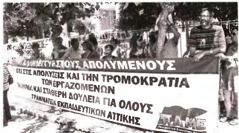
Από παλιότερες κινητοποιήσεις ενάντια στη διαθεσιμότητα των εκπαιδευτικών και τις απολύσεις

Στην κινητοποίηση του Σαββάτου, στη Λάρισα, καλεί το ΔΣ της ΟΛΜΕ, ενώ κάλεσμα απευθύνουν και μια σειρά ΕΛΜΕ. Οι Α', Β', Γ', Δ' και Ε' ΕΛΜΕ Θεσσαλονίκης προγραμματίζουν προ-