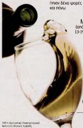
ΓΡΗΤΣ: ΕΡΕΥΝΗΤΙΚΟ ΠΑΝΕΠΙΣΤΗΜΙΑΚΟ ΚΕΝΤΡΟ ΚΑΤΑΝΑΛΩΣΗΣ

ΣΥΧΝΟΤΗΤΑ ΚΑΤΑΝΑΛΩΣΗΣ (από άτομα 13-19 ετών) 60,8% ήπιαν κάποιο οινόπνευματώδες ποτό 11,3% ήπιαν δέκα φορές και πάνω