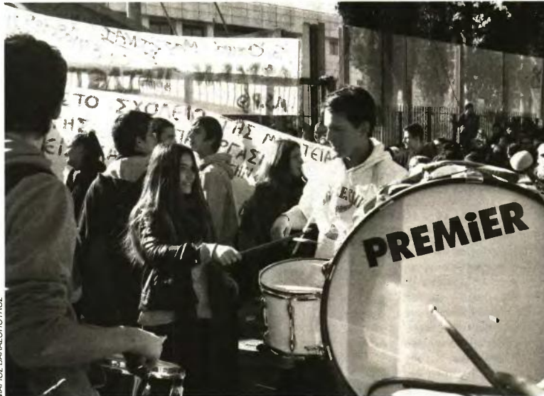
Τον τόνο στη χθεσινή κινητοποίηση έξω από το υπουργείο Παιδείας έδωσαν οι μαθητές των μουσικών σχολείων

• Ο καθηγητής Κώστας Ζώρας και πρώην αντιπρύτανης Πανεπιστημίου Αθηνών το- νίζει: «Για πρώτη φορά μετά το 1974 διό- κεται εκλεγμένος δημοκρατικά Πρύτανης δημόσιου πανεπιστημιακού ιδρύματος, κάτι που ιστορικά παραπέμπει εμμέσως στην παρουσία "κυβερνητικών επιρροών" στις πανεπιστημιακές σχολές διαρκούντος του στρατιωτικού δικτατορικού καθεστώτος της περιόδου 1967-1974».