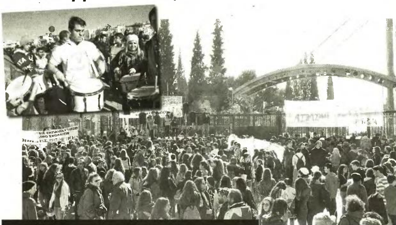
Από τη χτεσινή κινητοποίηση στο υπουργείο Παιδείας