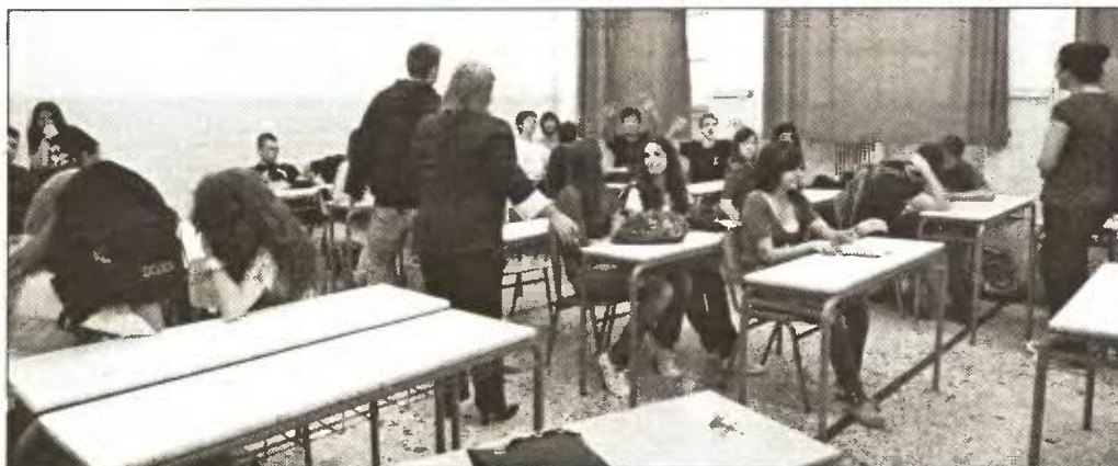
Οι δαπάνες του 2014 στον τακτικό προϋπολογισμό μειώνονται κατά 5,8% για την Παιδεία

Α ντιδράσεις και ανησυχία για το μέλλον της δημόσιας εκπαίδευσης έχουν προκαλέσει στους εκπαιδευτικούς, τα όσα περιλαμβάνονται στον προϋπολογισμό που κατατέθηκε για την Παιδεία, κάνοντας λόγο για τον χειρότερο προϋπολογισμό, των τελευταίων ετών.