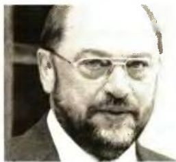
Μάρτιν Σουλτς, πρόεδρος του Ευρωκοινοβουλίου.

καλύπτονται λόγω έλλειψης του διδακτικού προσωπικού φτάνουν τις 5.074.