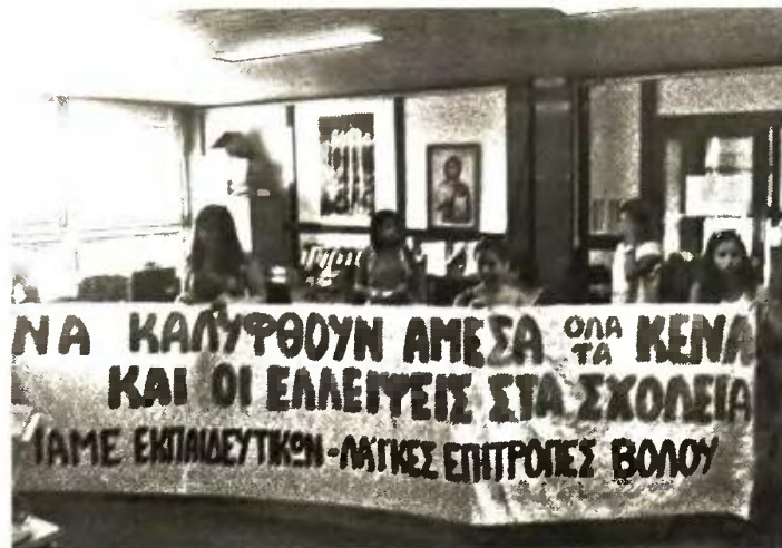
Στιγμιότυπο από παλιότερη κινητοποίηση στο Βόλο

Ενδεικτικά αναφέρονται μεταξύ άλλων η περιοχή της Α' Αθήνας που τα κενά είναι 35 χωρίς να περιλαμβάνονται οι ειδικότητες που καταργήθηκαν στα ΕΠΑΛ, η Εύβοια με 45 κενά, η Ηλεία με 50, η Κοζάνη όπου σύμφωνα με την ΟΛΜΕ, ελλείπει πιστώσεων αναπληρωτών, σε σχολεία δεν διδάσκονται πανελλαδικώς εξεταζόμενα μαθήματα, των Χανίων όπου σε ένα μόνο ΕΠΑΛ χάνονται 145 ώρες και τα κε-