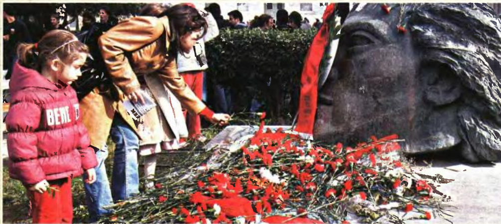
9.000 ΑΣΤΥΝΟΜΙΚΟΙ ΘΑ... ΣΥΜΜΕΤΑΣΧΟΥΝ ΣΤΟΥΣ ΕΟΡΤΑΣΜΟΥΣ ΤΟΥ ΠΟΛΥΤΕΧΝΕΙΟΥ

Αύριο θα κάνουν αποκλεισμό του υπουργείου Παιδείας και θα ακολουθήσει συνέλευση των εκπαιδευτικών σε διαθεσιμότητα.