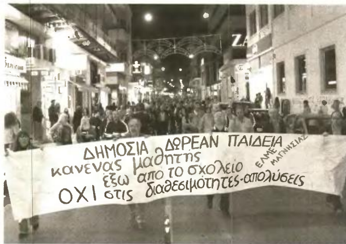
● Το συλλαλητήριο πραγματοποιήθηκε με τους εκπαιδευτικούς να κρατούν πανό και να φωνάζουν συνθήματα υπέρ του δημόσιου σχολείου