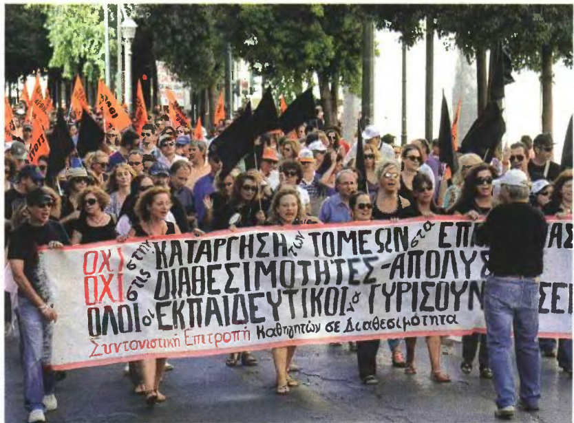
Προς νέες κινητοποιήσεις προανατολίζεται η ΟΛΜΕ

Συνεκτιμώντας όλες τις παραμέτρους (μείωση πιστώσεων, κατάργηση αναπληρωτών από του χρόνου, συνταξιοδοτήσεις, πιθανές νέες διαθεσιμότητες από τις δεξαμενές των υπεραριθμών που δημιουργούνται με διάφορα θεσμικά