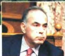
Χθες ο υπουργός Παιδείας Κωνσταντίνος Αρβανιτόπουλος διαβίβασε στην εισαγγελία του Αρείου Πάγου την παραγγελία του προς τα πανεπιστήμια, με την οποία τους ζητά να παραδώσουν τα στοιχεία των διοικητικών υπαλλήλων, ώστε να προχωρήσει η διαδικασία της διαθεσιμότητας.