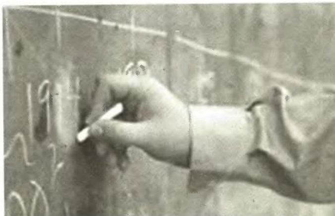
● Την ερχόμενη Πέμπτη οι καθηγητές της Μαγνησίας θα αποφασίσουν για κινητοποιήσεις

Στο μεταξύ ένα ακόμη ζήτημα που έχει προκύψει, αφορά τους καθηγητές που πήραν μετάταξη στην πρωτοβάθμια εκπαίδευση και για τους οποίους εκτός από μια ανακοίνωση του Υπουργείου Παιδείας δεν είχε βγει κάποιο ΦΕΚ που να επικυρώνει