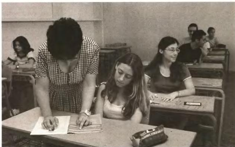
Η αξιολόγηση των εκπαιδευτικών θα γίνει βάσει της συνολικής προϋπηρεσίας τους και των τίτλων σπουδών, ενώ συνυπολογίζονται και κοινωνικά κριτήρια, όπως είναι οι οικογενειακοί λόγοι.

Τα κριτήρια με τα οποία οι καθηγητές θα αλληλάζουν υπηρεσία