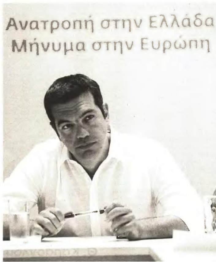
Ο Αλέξης Τσίπρας πρόκειται να μιλήσει σήμερα στην Κέρκυρα σε ακόμη μία... προεκλογικού τύπου συγκέντρωση του ΣΥΡΙΖΑ, την πρώτη μετά το τέλος των καλοκαιρινών διακοπών.

Ο αρχηγός της αξιωματικής αντιπολίτευσης αναμένεται να τονίσει πως απέναντι στο "απόλυτο αδιέξοδο" στο οποίο έχουν οδηγήσει την ελληνική κοινωνία και οικονομία τα μνημόνια και οι μνημονιακές κυβερνήσεις μπορεί να υπάρξει μόνον μία δημοκρατική διέξοδος με εκλογές αμέσως μετά το Σεπτέμβριο, ώστε μία κυβέρνηση της Αριστεράς με νωπή λαϊκή εντολή να μπορέσει να διαχειριστεί τα ζητήματα του χρέους, της παραγωγικής ανασυγκρότησης και