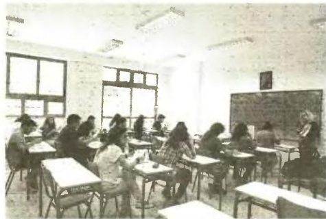
Η «κόντρα» κυβέρνησης - ηγεσίας της ΟΛΜΕ, γύρω από το θέμα «ανοιχτά ή κλειστά σχολεία το Σεπτέμβριο» αποπροσανατολίζει εντελώς από το μείζον θέμα που είναι το νομοσχέδιο της κυβέρνησης για το Λύκειο

Τ η συζήτηση περί «ανοιχτών ή κλειστών σχολείων το Σεπτέμβριο», που πολύ «βολικά» επισκιάζει το μεγάλο ζήτημα των αλλαγών στη δευτεροβάθμια εκπαίδευση, πυροδότησε η χθεσινή συνάντηση του ΔΣ της ΟΛΜΕ με τον υπουργό Παιδείας. Το νομοσχέδιο για τη δευτεροβάθμια εκπαίδευση φέρνει αλλαγές που οδηγούν βίαια τα παιδιά από τα 15 τους χρόνια στην κατάρτιση, που κάνουν το λύκειο ελιτίστικο προβάδισμα των πανεπιστημίων για όσους έχουν να πληρώσουν, που καθιερώνουν το μοντέλο της «μαθητείας» για παιδιά που κανονικά θα έπρεπε να βρίσκονται στο σχολείο και όχι έρμια στην εμετάλλευση. Οι εξελίξεις αυτές, που καταδικάζουν στην αμορφωσιά χιλιάδες παιδιά, παραμένουν έξω από τη συζήτηση που φουντώνει μεν γύρω από τα ζητήματα της Παιδείας, περιορίζεται όμως στο αν θα ανοίχουν ή όχι τα σχολεία το Σεπτέμβριο και εξελίσσεται σε μία κόντρα συνδεδεμένη με τους σχεδιασμούς της κυβέρνησης και του ΣΥΡΙΖΑ.