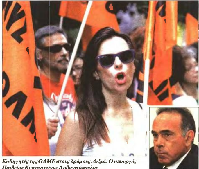
Καθηγητές της ΟΛΜΕ στους δρόμους. Δεξιά: Ο υπουργός Παιδείας Κωνσταντίνος Αρβανιτόπουλος

Μειώνονται εβδομαδιαίως τα δύο βασικά μαθήματα με απόφαση του υπ. Παιδείας Κ. Αρβανιτόπουλου