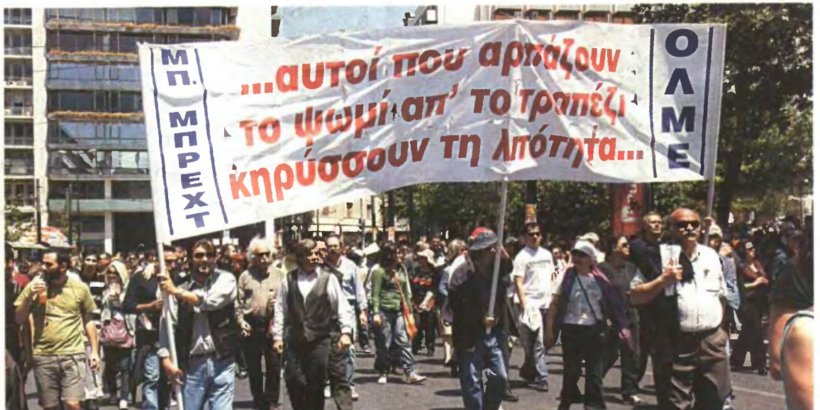
Η Ομοσπονδία θέλει να απαντήσουν τοίλημρά. Μένει στους εκπαιδευτικούς να αποφασίσουν για το αν θα βγουν ξανά στους δρόμους και για πόσο

»Μέριμνα όλων και ιδιαίτερα ημών, πρέπει να είναι -και είναι- η διασφάλιση της ομαλής λειτουργίας του εκπαιδευτικού συστήματος.