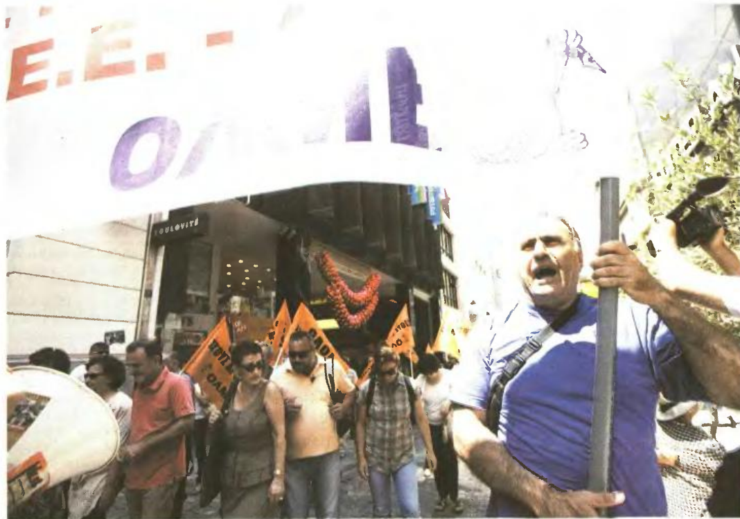
Μαζικές παραστάσεις διαμαρτυρίας προγραμματίζουν νωρίς σήμερα το πρωί, στις 7, καθηγητές των ΕΛΜΕ της Θεσσαλονίκης στις διευθύνσεις δευτεροβάθμιας εκπαίδευσης ανατολικής και δυτικής Θεσσαλονίκης.

Την ελπίδα ότι η πλειονότητα των εκπαιδευτικών δεν θα ευθυγραμμιστεί με τη γραμμή της ΟΛΜΕ για απεργιακές κινητοποιήσεις, ώστε "να μη γίνουν όμηροι τα παιδιά", εξέφρασε σε δηλώσεις του σε τηλεοπτικό σταθμό ο κυβερνητικός εκπρόσωπος Σίμος Κεδίκογλου. "Είμαι βέβαιος ότι η συντριπτική πλειονότητα των καθηγητών δεν θα δεχτεί καταστάσεις ανάλογες με αυτές που είχαμε τον περασμένο Μάιο, όταν η συνδικαλιστική ηγεσία της ΟΛΜΕ απέδειξε για άλλη μία φορά ότι είναι εκτός τόπου και χρόνου. Επαναλαμβάνω, θέλω να ελπίζω, θέλω να πιστεύω ότι η συντριπτική