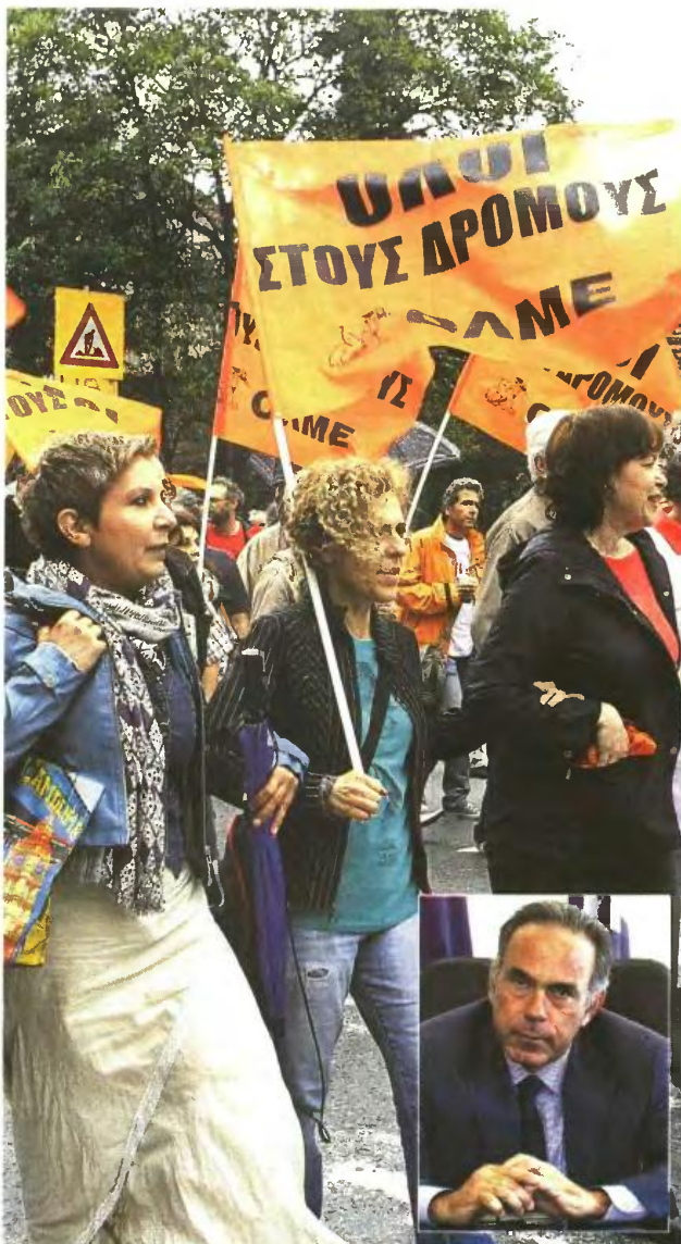
Με δυναμικές κινητοποιήσεις στην έναρξη της νέας σχολικής χρονιάς προειδοποιεί η ΟΛΜΕ, μετά το χθεσινό αδιέξοδο στη συνάντηση με τον υπουργό Παιδείας.

Ομαλά συνεχίζεται η διαδικασία των μετατάξεων σύμφωνα με το υπουργείο το οποίο εξέδωσε ενημερωτικό σημείωμα με ερωτήσεις και απαντήσεις, ώστε να διευκολύνει τους υπό μετατάξη εκπαιδευτικούς στις επιλογές τους. ■