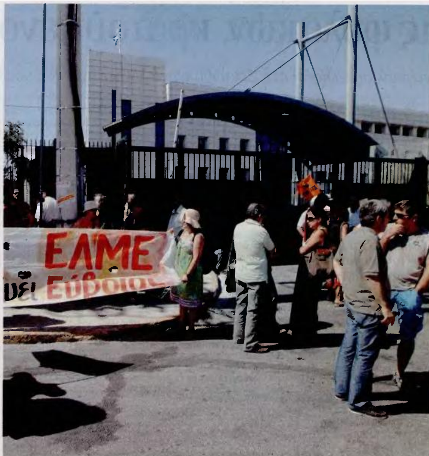
Παρά το «ήπιο κλίμα» της χθεσινής συνάντησης, υπουργείο Παιδείας και ΟΛΜΕ εμφανίζονται ανυποχώρητοι στις θέσεις τους. Η φωτογραφία από την προχθεσινή παράσταση διαμαρτυρίας μελών της ΟΛΜΕ έξω από το υπουργείο.

Η ΟΛΜΕ από τη μεριά της θεωρεί ότι δεν έλαβε ουσιαστικές απαντήσεις στα αιτήματά της, όπως η διακοπή των υποχρεωτικών μετατάξεων, η ικανοποίηση όσων αιτήσεων μετάταξης έχουν κατατεθεί εθελοντικά και ο υπολογισμός των σχολικών κενών στις αρχές Σεπτεμβρίου, «με βάση τις πραγματικές ανάγκες της εκπαίδευσης και όχι τις νόρμες των μνημονιακών συμφωνιών». Ταυτόχρονα, η ΟΛΜΕ ζήτησε να ακρωθεί η υπαγωγή σε διαθεσιμότητα των εκπαιδευτικών της Τεχνικής Επαγγελματικής Εκπαίδευσης και σε κάθε περίπτωση να γίνει άμεση εργασιακή αποκατάστασή τους μέσα στις υπηρεσίες του υπουργείου Παιδείας. Τέλος, οι συνδικαλιστές ζήτησαν