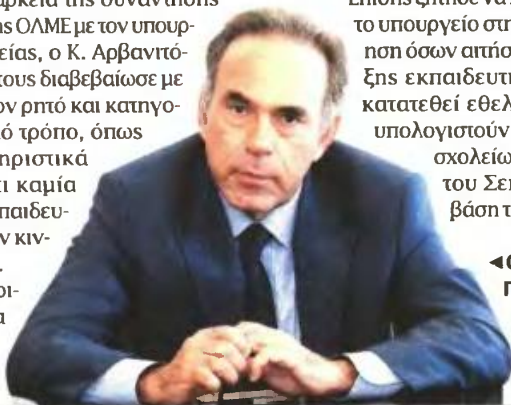
◀ Ο ΥΠΟΥΡΓΟΣ Παιδείας, Κ. Αρβανιτόπουλος

Όπως υπογράμμισαν και οι συνδικαλιστές -οι οποίοι θα επιμένουν στη θέση τους για απεργίες με την έναρξη του σχολικού έτους- «όσον αφορά το θέμα της διαθεσιμότητας εκπαιδευτικών, ο υπουργός Παιδείας επέμεινε στην πολιτική που έχει ψηφιστεί και δεν δέχεται το αίτημά μας για την επαναφορά των εκπαιδευτικών και των τομέων - ειδικότητων της ΤΕΕ. Επίσης, δεν δεσμεύτηκε ότι θα απορροφηθούν όλοι. Δήλωσε ότι δεν θα υπάρξουν άλλες διαθεσιμότητες εκπαιδευτικών».