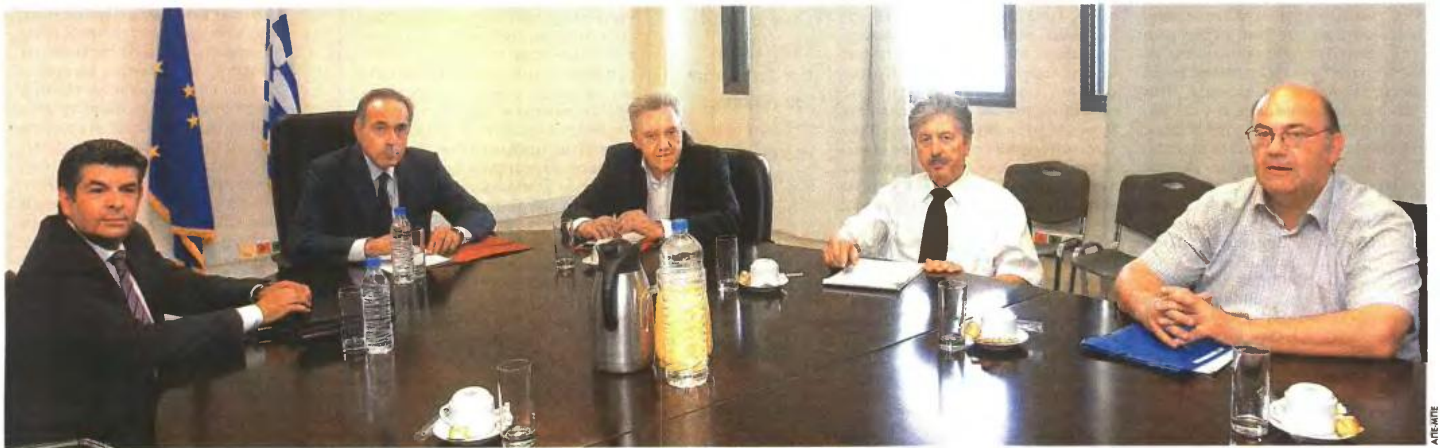
Ο υπουργός Παιδείας Κωνσταντίνος Αρβανιτόπουλος (δεύτερος από αριστερά) συζητάει με το πρόεδρο της ΟΛΜΕ κατά τη διάρκεια συνάντησης που είχαν στο υπουργείο

Η ΔΙΑΘΕΣΙΜΟΤΗΤΑ. Για τη διαθεσιμότητα ο κ. Αρβανιτόπουλος είπε ότι ήδη έχει ληφθεί μέριμνα «ώστε αυτοί που έχουν να κάνουν με επαγγέλματα Υγείας, και αυτό είναι περίπου το 60% του αριθμού, να απορροφηθούν από οργανισμούς του υπουργείου Υγείας. Γίνεται μεγάλη προσπάθεια ούτως ώστε και οι υπόλοιποι να απορροφηθούν από άλλους οργανισμούς του Δημοσίου, αλλά και υπηρεσίες του υπουργείου Παιδείας που σχετίζονται με την κατάρτιση». Και στα δύο θέματα η ΟΛΜΕ δεν έμεινε ικανοποιημένη από τις απαντήσεις που πήρε από το υπουργείο.