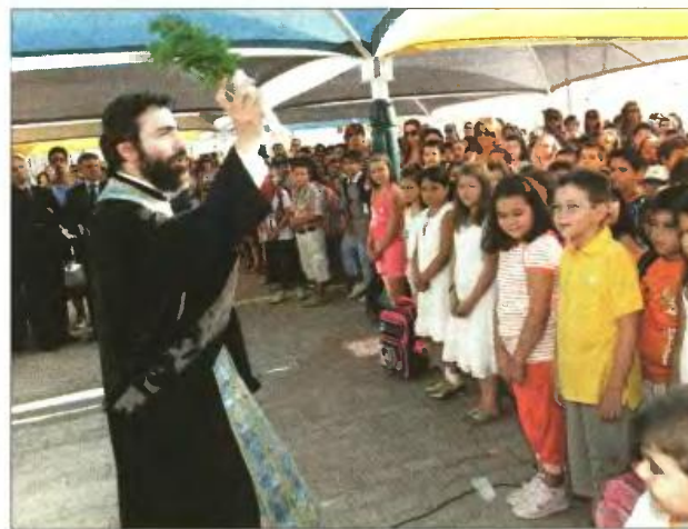
» Οι καθηγητές απειλούν ότι θα κλείσουν τα σχολεία αμέσως μετά τον καθιερωμένο Αγιασμό

Στα άκρα οδηγείται η σύγκρουση κυβέρνησης - καθηγητών μετά το χθεσινό ναύαγιο στις διαπραγματεύσεις. Ο Κ. Αρβανιτόπουλος υποστήριξε πως με την έναρξη της νέας σχολικής χρονιάς τα σχολεία και τα πανεπιστήμια θα είναι ανοιχτά και οι εκπαιδευτικοί στις θέσεις τους, κάτι που θα μπορούσε να ερμηνευτεί ως απειλή επίταξης. Ωστόσο, ο πρόεδρος της ΟΛΜΕ, Θ. Κοτσιφάκης, αμέσως μετά τη συνάντηση, δήλωσε ότι οι εκπαιδευτικοί δεν πήραν απαντήσεις στα βασικά ζητήματα που τους απασχολούν και προανήγγειλε κινητοποιήσεις.