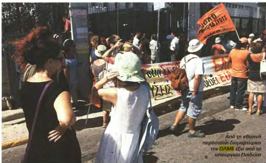
Από τη χθεσινή παράσταση διαμαρτυρίας της ΟΛΜΕ έξω από το υπουργείο Παιδείας