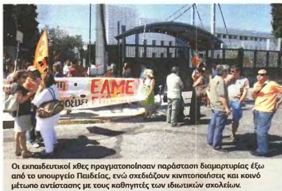
Οι εκπαιδευτικοί χθες πραγματοποίησαν παράσταση διαμαρτυρίας έξω από το υπουργείο Παιδείας, ενώ σχεδιάζουν κινητοποιήσεις και κοινό μέτωπο αντίστασης με τους καθηγητές των ιδιωτικών σχολείων.

Αλλαγές πραγματοποιούνται και στις ώρες διδασκαλίας ξένων γλωσσών στο Γυμνάσιο. Οι μαθητές θα έχουν μία λιγότερη ώρα διδασκαλίας Αγγλικών, καθώς θα έχουν από δύο