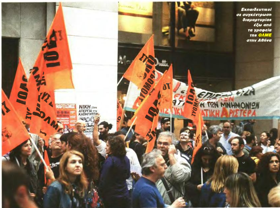
Εκπαιδευτικοί σε συγκέντρωση διαμαρτυρίας έξω από τα γραφεία της ΟΛΜΕ στην Αθήνα

Υπενθυμίζεται ότι η Ομοσπονδία έχει καλέσει το υπουργείο Παιδείας να ανακαλέσει τις υποχρεωτικές μετατάξεις εκπαιδευτικών από τη Δευτεροβάθμια στην Πρωτοβάθμια. Είχε ανακοινώσει μάλιστα πως στην απόφαση του υπουργείου για τις μετατάξεις τίθενται παράδεκτα χρονικά πλαίσια για τις αιτήσεις (14-23/8) και μένουν αναπάντητα πολλά και σοβαρά ερωτήματα. Πηγές του υπουργείου Παιδείας τόνιζαν χτες στα «ΝΕΑ» πως στόχος είναι η διαδικασία των μετατάξεων να ολοκληρωθεί εγκαίρως έτσι ώστε την 1η Σεπτεμβρίου οι εκπαιδευτικοί να βρίσκονται στα σχολεία όπου θα διδάξουν κατά τη νέα σχολική χρονιά.