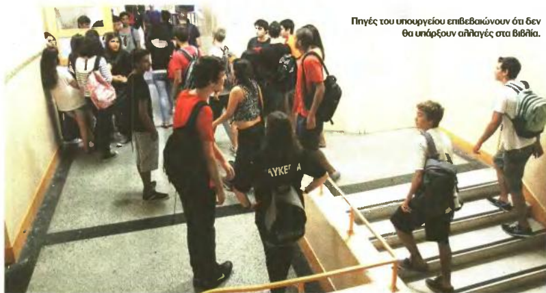
Πηγές του υπουργείου επιβεβαιώνουν ότι δεν θα υπάρχουν αλλαγές στα βιβλία.

ΔΕΝ ΑΡΓΕΙ Η ΨΗΦΙΣΗ ΤΟΥ ΝΟΜΟΣΧΕΔΙΟΥ ● ΣΤΟΧΟΣ Η ΑΜΕΣΗ ΕΝΤΑΞΗ ΤΩΝ ΜΑΘΗΤΩΝ