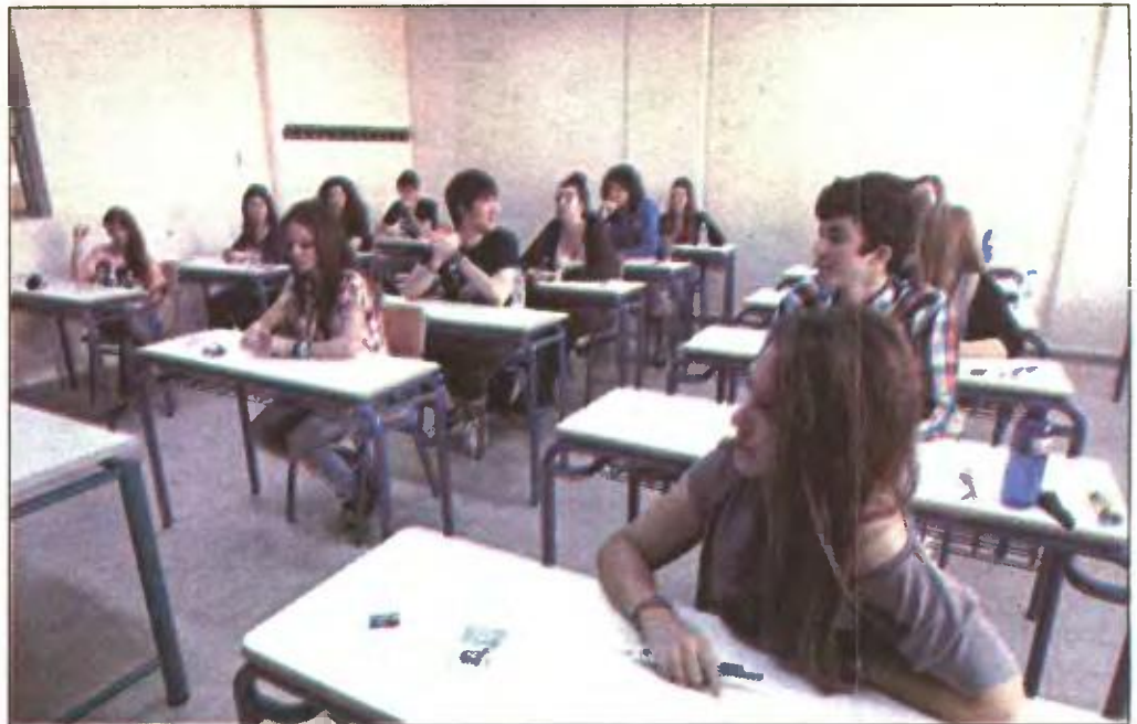
Οι αλλαγές θα τεθούν σε ισχύ, εφόσον ψηφιστεί το σχετικό νομοσχέδιο, από το νέο σχολικό έτος

Ξεχωριστό θα είναι το πεδίο για τις στρατιωτικές-αστυνομικές σχολές.