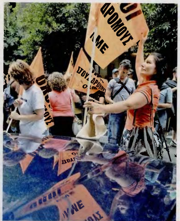
Κινητοποιήσεις ευρείας κλίμακας έχουν προαναγγείλει ήδη οι συνδικαλιστικές ενώσεις των εκπαιδευτικών για το φθινόπωρο.

Στην Κουμουνδούρου προετοιμάζουν, επίσης, μια μεγάλη διαδήλωση στη Θεσσαλονίκη κατά τη διάρκεια της Διεθνούς Εκθέσεως. Από την πλευρά του ΣΥΡΙΖΑ θεωρούν τη διαδήλωση της ΔΕΘ ως «βαρόμετρο», το οποίο και θα προδιαγράψει το μέλλον της κυβέρνησης. Αλλωστε, στην Κουμουνδούρου θεωρούν ότι η περιόδος από τις γερμανικές εκλογές (22 Σεπτεμβρίου) μέχρι και τον Νοέμβριο, ενδεχομένως οδηγήσει