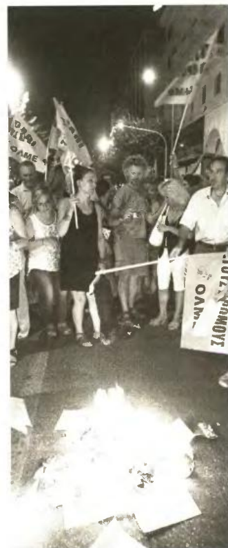
Συγκέντρωση στον πεζόδρομο της Αριστοτέλους πραγματοποιήσαν εκπαιδευτικοί της Θεσσαλονίκης, όπου σε ένδειξη διαμαρτυρίας έκαψαν τις διαπιστωτικές πράξεις με τις οποίες ενημερώθηκαν για την ένταξή τους σε καθεστώς κινητικότητας.

μοσχεδίου για το νέο λύκειο, και δεδομένων των διαρροών για επικείμενες αλλαγές σε λύκεια αλλά και γυμνάσια, καθηγητές πολλών ειδικοτήτων -οι οποίες πλήττονται καθώς είτε καταργούνται είτε υφίστανται μείωση των ωρών διδασκαλίας- προχωρούν σε ανακοινώσεις και ψηφίσματα διαμαρτυρίας. Μεταξύ των επόμενων κλάδων περιλαμβάνονται καθηγητές πληροφορικής, μουσικής, καλλιτεχνικών, αγγλικής γλώσσας κ.ά. Υπενθυμίζεται ότι με την πρόσφατη κατάργηση 50 ειδικοτήτων στην επαγγελματική εκπαίδευση έχουν ήδη τεθεί σε διαθεσιμότητα 2.122 καθηγητές δευτεροβάθμιας εκπαίδευσης και αναμένονται εξελίξεις - για παράδειγμα, περισσότεροι από 1.300 καθηγητές τεχνολογίας βρίσκονται «στον αέρα» ενόψει κατάργησης του μαθήματος στο νέο ωρολόγιο πρόγραμμα του γυμνασίου, ενώ αβεβαιότητα επικρατεί και μεταξύ καθηγητών μουσικής και καλλιτεχνικών λόγω σημαντικής μείωσης των ωρών διδασκαλίας. Σε κάθε περίπτωση, τα συνδικαλιστικά όργανα των εκπαιδευτικών παραμένουν σε ετοιμότητα και προαναγγέλλουν δυναμικές κινητοποιήσεις τον Σεπτέμβριο, καλώντας τις κατά τόπους ενώσεις σε εγρήγορση.