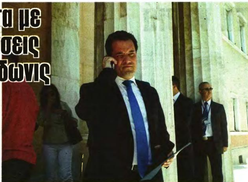
Έτοιμοι για μαράζι κινητοποιήσεων είναι οι εργαζόμενοι, οι οποίοι κατηγορούν τον υπουργό για άγνοια και έλλειψη επιστημονικών δεδομένων στις προωθούμενες αλλαγές

«Αν γίνουν οι απολύσεις που αναφέρει η εφημερίδα, εγώ θα παραιτηθώ από υπουργός», ισχυρίστηκε, συμπληρώνοντας πως στην αντίθετη περίπτωση περιμένει όχι μόνο την παραίτηση του συντάκτη του επίμαχου άρθρου, αλλά και τη διακοπή κυκλοφορίας της εφημερίδας. Καταλήγοντας ο υπουργός επανέλαβε ότι δεν πρόκειται να απολυθεί κανένας από τους 1.618 εργαζομένους που μπαίνουν άμεσα σε πρόγραμμα κινητικότητας από τον χώρο της Υγείας.