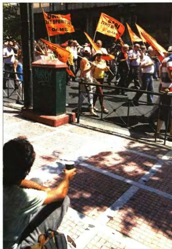
Από τις χθεσινές συγκεντρώσεις στο κέντρο της Αθήνας. Σε πρώτο πλάνο ένας επίτιμος

«Η δέσμευσή μας είναι να συνεισφέρουμε στην κινητικότητα με 1.500 άτομα. Αυτή η δέσμευση θα τηρηθεί στο ακέραιο. Οι καλόπιστοι πιστεύω ότι έχουν καταλάβει ότι πρόθεση του υπουργείου Υγείας είναι να γίνουν όλα γρήγορα και σωστά, χωρίς να υπάρχει καμιά απόλυση. Οι κακόπιστοι, οι οποίοι προσπαθούν να παίξουν κομματικά παιχνίδια, προφανώς θα αντιδράσουν» τόνισε σε δήλωσή του ο υπουργός Υγείας Αδωνης Γεωργιάδης. Οι περίπου 1.300 υπάλληλοι του υπουργείου Παιδείας θα είναι διοικητικοί των ΑΕΙ και των ΤΕΙ της χώρας που θα προκύψουν έπειτα από αυτοαξιολόγηση των εκπαιδευτικών ιδρυμάτων. Οι περισσότεροι από τους 600 εργαζομένους του υπουργείου Εργασίας που θα ενταχθούν σε διαθεσιμότητα θα προέλθουν από τα ασφαλιστικά ταμεία αλλά και εποπτευόμενα νομικά πρόσωπα, ενώ οι περίπου 400 πλεονάζοντες του υπουργείου Οικονομικών θα είναι κυρίως από τους οδηγούς και τις καθαρίστριες.