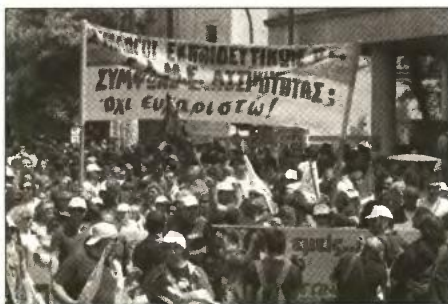
✓ Μέλημα της κυβέρνησης η στήριξη της ιδιωτικής εκπαίδευσης