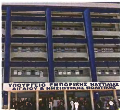
Τεταμένο είναι τις τελευταίες ημέρες το κλίμα στο υπουργείο