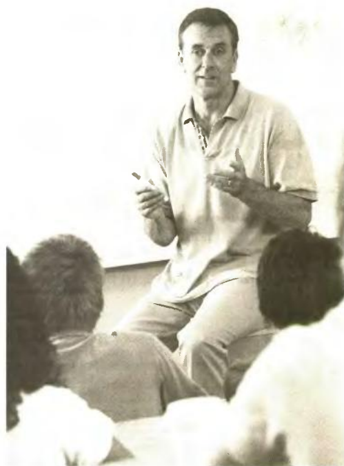
▲ ΟΙ ΕΚΠΑΙΔΕΥΤΙΚΟΙ που τίθενται σε διαθεσιμότητα, μετά το πέρας της περιόδου διαθεσιμότητας, μπορούν να προσλαμβάνονται κατά προτεραιότητα έναντι των άλλων εκπαιδευτικών ως ωρομίσθιο εκπαιδευτικό προσωπικό, για την κάλυψη αναγκών της Δευτεροβάθμιας Εκπαίδευσης

Από αυτές τις ειδικότητες, αλλά και άλλες συναφείς του τομέα Υγείας που φαίνονται στον πίνακα, αρκετοί εκπαιδευτικοί θα επαναπροσληφθούν σε υπηρεσίες και δομές του υπουργείου Παιδείας. Όπως αναφέρει το υπουργείο, από τους 2.000 το 55% θα επαναπροσληφθεί.