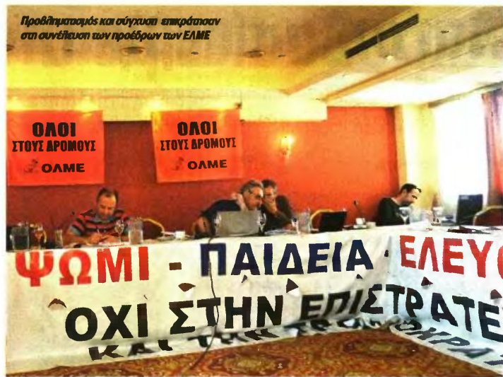
Της Αφροδίτης Τζαυτζή