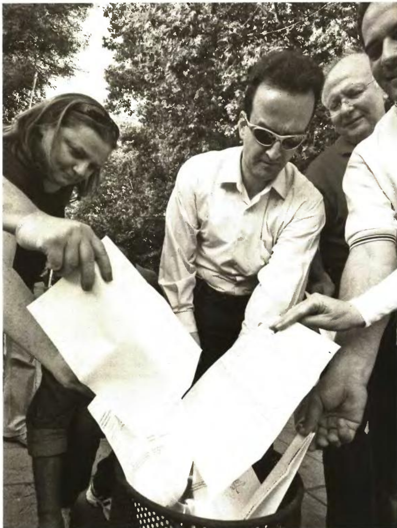
Η αποφασιστικότητα των καθηγητών που αφήφισαν τις απειλές και ψήφισαν μαζικά υπέρ της απεργίας, καίγοντας μάλιστα σε πολλές περιπτώσεις τα φύλλα πορείας, θορύβησε την κυβέρνηση αλλά και εξεπλήξε την ίδια τη συνδικαλιστική τους ηγεσία

■ Σε κατάσταση συναγερμού η κυβέρνηση. Ετοιμος να απαγορεύσει τις συγκεντρώσεις στα εξεταστικά κέντρα ήταν ο Ν. Δένδιας