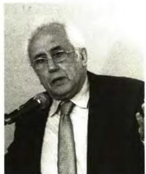
«Το νομοσχέδιο θα κατατεθεί το συντομότερο» δεσμεύτηκε ο υπουργός Δικαιοσύνης

Το ζήτημα αυτό τέθηκε ουσιαστικά στο χθεσινό συνεδρίαση της Εκτελεστικής Επιτροπής της ΔΗΜ.ΑΡ. με αφορμή την επιστράτευση των εκπαιδευτικών, αλλά και το «παγωμένο» αντιρατσιστικό νομοσχέδιο. Ο Αντ. Ρουπακιώτης, που παρευρέθηκε στη συνεδρίαση προκειμένου να ενημερώσει τα ηγετικά στελέχη της ΔΗΜ.ΑΡ. για το περιεχόμενο του αντιρατσιστικού νομοσχεδίου, συμφώνησε με πληροφορίες δεν θέλησε να τοποθετηθεί «ειδικά» για το θέμα της επιστράτευσης των εκπαιδευτικών, καθότι ο ίδιος διατελεί υπουργός Δικαιοσύνης, αλλά και διότι υπάρχει ήδη