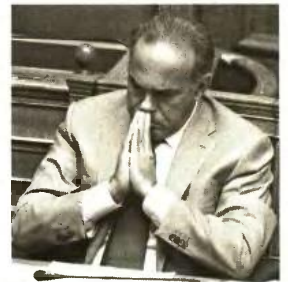
Ο υπουργός Παιδείας Κ. Αρβανιτόπουλος και κάτω ο υπουργός Δ. Τάξης Ν. Δένδιας

Το προεδρείο της ΟΛΜΕ επισκέφθηκε χθες το μεσημέρι τον γραμματέα της Ν.Δ. Μ. Κεφαλογιάννη, από τον οποίο ζήτησε να παρέμβει προς το υπουργείο Παιδείας και να παγώσει το επίμαχο Π.Δ. ώστε να δοθεί χρόνος για διάλογο.