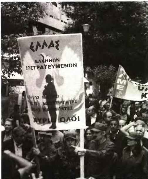
«Η καθολική απαγόρευση του δικαιώματος των εκπαιδευτικών στην απεργία, που επιβάλλεται με την ποινική δίωξη και την απειλή της ποινής φυλάκισης, είναι σαφώς μη αναγκαία και δυσανάλογη και θα παραβιάζε τις διεθνείς υποχρεώσεις της Ελλάδας στα ανθρώπινα δικαιώματα» τονίζει η Διεθνής Αμνηστία