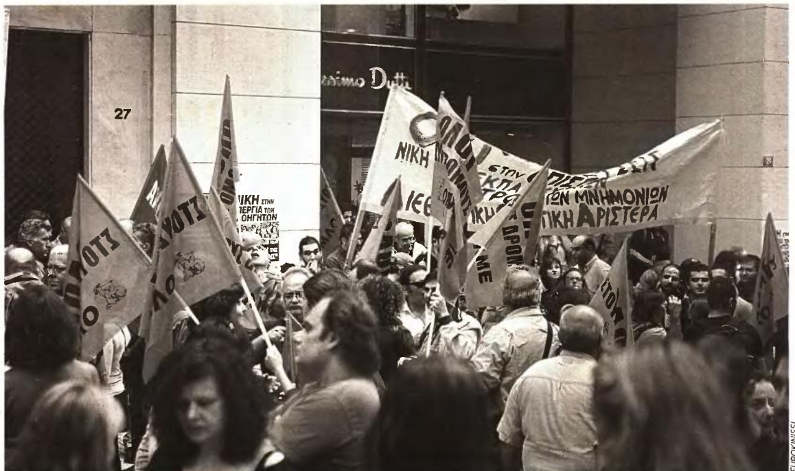
Αρχίζουν αύριο οι πανελλαδικές εξετάσεις, επειδή οι επιτελείς της ΟΛΜΕ τρόμαξαν από την αγωνιστική εντολή που τους έδωσαν οι μαχητικές συνελεύσεις των ΕΑΜΕ

Εν μέσω καταγγελιών για στημένες διαδικασίες και συνδικαλιστικά παιχνίδια από τις πλειοψηφικές παρατάξεις της ΟΛΜΕ (ΔΑΚΕ, ΠΑΣΚ, ΣΥΝΕΚ, δηλαδή Ν.Δ., ΠΑΣΟΚ, ΣΥΡΙΖΑ) έγινε το μεγάλο κόλπο. Να κατεβεί σε διπλή ψηφοφορία (α) η αρχική πρόταση για απεργία και (β) η αποδοχή των όρων και των προϋποθέσεων για σπάσιμο της επιστράτευσης. Η πρώτη πρόταση πέρασε με άνετη πλειοψηφία. Σε σύνολο 85 ΕΑΜΕ πήρε 78 υπέρ, 4 κατά, 3 λευκά. Η δεύτερη δεν πέρασε λόγω... λευκών. Πήρε 18 υπέρ, 9 κατά και 57 λευκά από προέδρους που κατήγγελλαν τη διαδικασία. Σε μια ατιμωσιμότητα δραματικής σύγκρουσης, η πλειοψηφία του Σώματος φώναζε στο προεδρείο της ΟΛΜΕ να θέλει την αναστολή της απεργίας να το πει καθαρά. Νωρίτερα, βέβαια, το είχε τομήσει, αλλά επειδή δεν μύρισε να το περάσει το πήρε γρήγορα πίσω. Περίπου το 30% των προέδρων τάσσονταν υπέρ της άρνησης στην επιστράτευση ενώ δι-