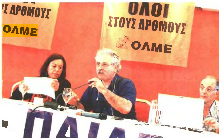
▲ ΜΑΡΑΘΩΝΙΑ ήταν η χθεσινή συνεδρίαση της ολομέλειας των προέδρων των ΕΛΜΕ, όπου αποφασίστηκε να μην επιχειρηθεί από τον κλάδο «σπάσιμο» της επιστράτευσης