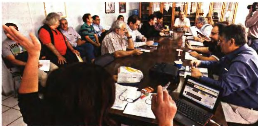
Τη... λύση στο αδιέξοδο έδωσαν οι 8 συνδικαλιστές του διοικητικού συμβουλίου της ΟΛΜΕ, οι παρατάξεις των οποίων πρόσκαιται στη Νέα Δημοκρατία, στο ΠΑΣΟΚ και στον ΣΥΡΙΖΑ

Η πρόταση-ερώτημα ήταν: «Υπάρχουν οι πολιτικοί όροι και προϋποθέ-