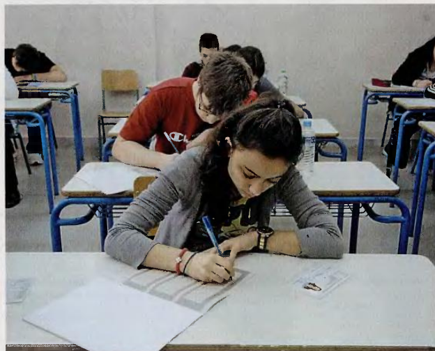
Η διαδικασία των πανελλαδικών εξετάσεων έχει απειληθεί πολλές φορές από τις κινητοποιήσεις των εκπαιδευτικών.

Κράτησε 37 ημέρες εν μέσω των εξετάσεων, κηρύχθηκε παράνομη και καταχρηστική. Οι εκπαιδευτικοί πέτυχαν χορηγηση επιδομάτων.