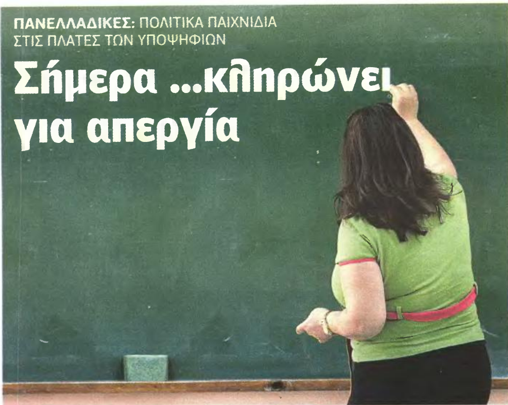
Αισιόδοξος ότι η απεργία «θα περάσει» στη σημερινή συνεδρίαση που ορίστηκε να ξεκινήσει στις 12 το μεσημέρι δήλωσε χθες βράδυ μετά τις εξελίξεις ο πρόεδρος της ΟΛΜΕ.

Σ ε θρίλερ εξελίσσεται η υπόθεση της απεργίας των καθηγητών μέσα στις πανελλαδικές εξετάσεις. Από χθες βράδυ που διακόπηκε η συνεδρίαση του Δ.Σ. της ΟΛΜΕ, η απεργία δεν είναι πια βέβαιη, αλλά πιθανή.