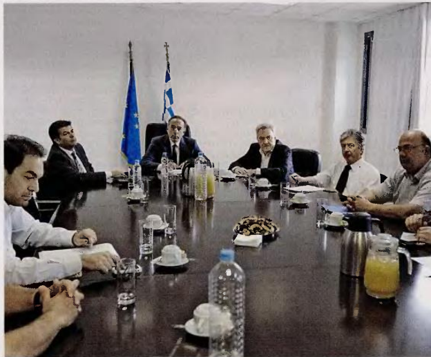
Από την προχθεσινή, άκαρπη, συνάντηση του υπουργού Παιδείας με το προεδρείο της ΟΛΜΕ.

• Λίγους μήνες αργότερα, μπαίνουν στον χορό των κινητοποιήσεων οι μαθητές, προχωρώντας σε καταλήψεις από τον Νοέμβριο του 1998 έως τις αρχές Φεβρουαρίου του 1999, με αίτημα την κατάργηση των ν. 2525/97 και 2640/98, που αφορούν στη δομή του λυκείου και στο σύστημα εισαγωγής στην Τριτοβάθμια Εκπαίδευση. Το πρώτο δεκαήμερο του Δεκεμβρίου τα 2/3 των λυκείων και περίπου 200 γυμνάσια τελούν υπό κατάληψη. Οι κινητοποιήσεις συνεχίζονται μετά τις χριστουγεννιάτικες διακοπές. Μάλιστα, γίνονται και καταλήψεις δημοτικών σχολείων με αιχμή την υποχρεωτική επαναφορά του ορίου των 30 μαθητών ανά τάξη.