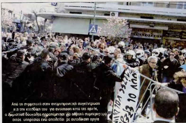
Από τη συμμετοχή στην αντιμνημονιακή συγκέντρωση και την κλιμάκηση του για αντίσταση κατά της αρχής, ο Λαρισσιός δάσκαλος παραπέμπεται για απρεπή συμπεριφορά εκτός υπηρεσίας ενώ απειλείται με αυτοδίκαιη αργία

Υπενθυμίζεται πως στις 25 Μαρτίου του 2012 ήταν η πρώτη φορά που οι παρελάσεις είχαν γίνει με αυστηρά μέτρα ασφαλείας (μεταλλικά κιγκλιδώματα, έντονη αστυνομική παρουσία κλη) υπό το φόβο επεισοδίων με αφορμή και τις έντονες αντιδράσεις των πολιτών για τα νέα οικονομικά μέτρα. Συγκέντρωση διαμαρτυρίας είχε γίνει και στη Λάρισα