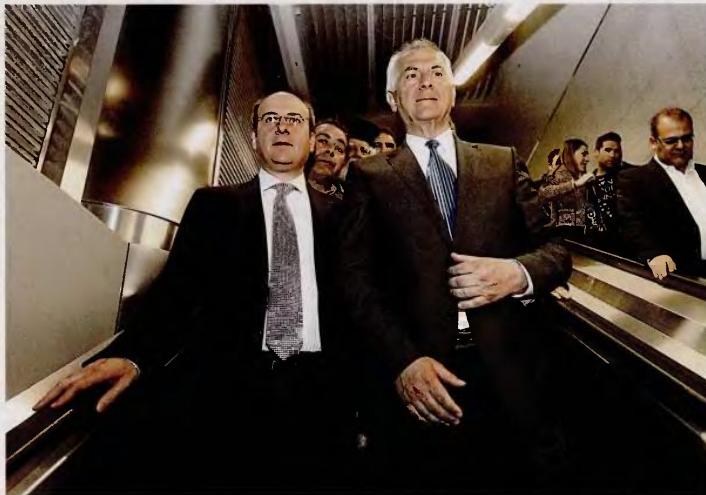
Ο υπουργός Ανάπτυξης , Ανταγωνιστικότητας, Υποδομών, Μεταφορών, Δικτύων κ.λπ. Κωστής Χατζηδόκης με τον δήμαρχο Περιστερίου Ανδρέα Πακατουρίδη (δεξιά), στα εγκαίνια του νέου σταθμού του Μετρό στο Περιστερί. Αξίζει να προσέξουμε πώς, μέσα σε μόλις δυο-τρία χρόνια, άφησαν τελείως τα μαλλά του δημάρχου. Πρέπει και αυτό να οφείλεται στο Μνημόνιο. Πού να περισσέψουν λεφτά για χρωματισμούς;

Στην Κύπρο , είπε ο Αλ. Τσιπρας, το «όχι» δεν προχώρησε, επειδή υπήρχε μεν η αποφασιστικότητα του λαού να αντισταθεί, αλλά δεν υπήρχε αποφασισμένη κυβέρνηση. Παραποιεί την πραγματικότητα,