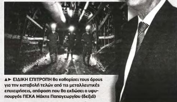
▲► ΕΙΔΙΚΗ ΕΠΙΤΡΟΠΗ θα καθορίσει τους όρους για την καταβολή τελών από τις μεταλλευτικές επιχειρήσεις, απόφαση που θα εκδώσει ο υφυπουργός ΠΕΚΑ Μάκης Παπαγεωργίου (δεξιά)

Σύμφωνα με τον υφυπουργό ΠΕΚΑ, η απόφαση θα καθορίζει το ποσοστό απόδοσης στους οικείους δήμους από τα εισπραττόμενα μισθώματα δημοσίων μεταλλείων, αλλά και τα τέλη υπέρ του Δημοσίου από τα ιδιωτικά μεταλλεία.