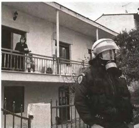
Οι φωτογραφίες στη διηγητική σελίδα και αριστερά, που δείχνουν σκηνές από τη χθεσινή εισβολή στην Ιερισό, τραβήχθηκαν από την Κατερίνα Σειτανίδου, ενώ η φωτογραφία δεξιά με τα παιδιά είναι από το Παρατηρητήριο Μεταλλευτικών Δραστηριοτήτων «Save Skouries»