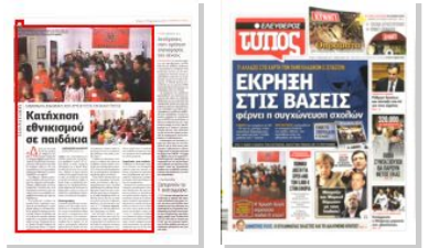
Εντύπωση προκάλεσαν οι φωτογραφίες που έδωσε χθες στη δημοσιότητα το ακροδεξιό κόμμα, στις οποίες απεικονίζονται ακόμα και νήπια κάτω από τα χρυσαυγίτικα σύμβολα.