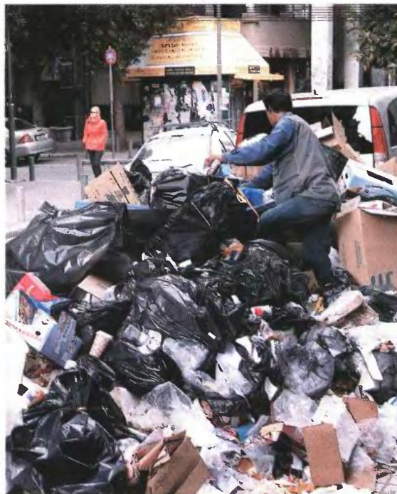
▲ ΤΑ ΣΚΟΥΠΙΔΙΑ αρχίζουν να συσσωρεύονται επικίνδυνα στην Αθήνα, με τους εργαζομένους στην καθαριότητα να απειλούν με αποχή

Σύμφωνα με τον νόμο 4093/2012, σε αργία τίθενται υπάλληλοι που έχουν παραπεμφθεί για σοβαρά ποινικά αδικήματα (κακοουρηματικές πράξεις, κλοπή, υπεξαίρεση, απάτη, εκβίαση, πλαστογραφία, δωροδοκία) ή σοβαρά πειθαρχικά παραπτώματα (άρνηση αναγνώρισης του Συντάγματος, αναζήρησις ή ανάρμοστη συμπεριφορά, αδικαιολόγητη αποχή, παράλειψη των πειθαρχικών οργάνων να προβούν σε δώξη και τιμωρία πειθαρχικού αδικήματος).