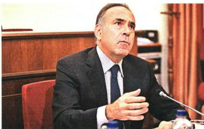
Εφαρμογή του Μνημονίου στην εκπαίδευση και μάλιστα με ταχύ ρυθμούς επιδίδει ο υπουργός Παιδείας

1. Επιτρέπεται «οι τους καθηγητές ΑΕΙ να απασχολούνται, υπό τις ανωτέρω ιδιότητες, σε μη κερδοσκοπικά ερευνητικά κέντρα τα οποία αποτελούν νομικά πρόσωπα ιδιωτικού δικαίου». Έχοντας αφήσει την πλήρη αποκλειστική απασχόληση στο απώτατο παρελθόν