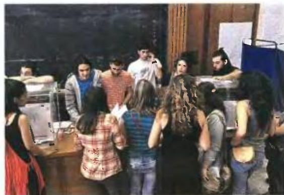
Το νομοσχέδιο του υπουργείου Παιδείας ξαναβάζει στο «παιχνίδι» των ΑΕΙ τις φοιτητικές παρατάξεις.