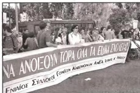
Από την κινητοποίηση του περασμένου Σαββάτου