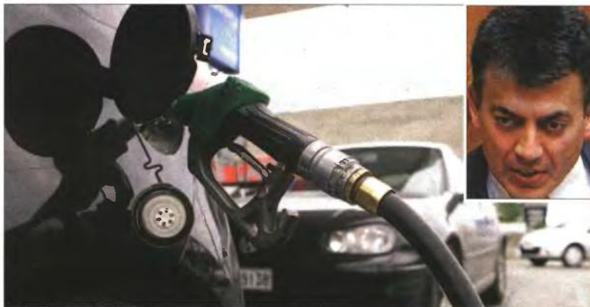
Δεν ήταν τυχαία η περικλήση του κοινωνικού πόρου την περασμένη Τρίτη στο Ταμείο Επικουρικής Ασφάλισης Πρατηριούχων Υγρών Καυσίμων (ΤΕΑΠΥΚ), με απόφαση του υπουργού Εργασίας Γ. Βρούτση (ένθετο)

Το υπουργείο Εργασίας με επίσημο έγγραφο που απέστειλε στο τέλος Σεπτεμβρίου καλεί όλα αυτά τα Ταμεία να αποφασίσουν τι θα πράξουν. Ειδικότερα, το έγγραφο εστάλη στα εξής ταμεία και ομοσπονδίες: Πανελλήνια Ομοσπονδία Ιατρικών Φαρμακευτικών Επιχειρημάτων και Συνάφων Επαγγελματιών και Κλάδων (ΠΟΙΦΕΕΚ), Ομοσπονδία Ιδιωτικών Υπαλλήλων Ελλάδος (ΟΙΥΕ), Πανελλήνια Ομοσπονδία Εργαζομένων