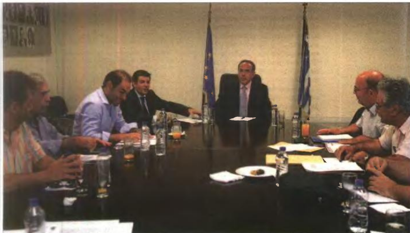
▲ Ο υπουργός Παιδείας Κώστας Αρβανιτόπουλος συνομιλεί με το προεδρείο της ΟΛΜΕ κατά τη διάρκεια της συνάντησης που είχαν στο υπουργείο

Την ίδια ώρα, σε απεργία έχουν προχωρήσει από χθες και οι πανεπιστημιακοί, ενώ σήμερα θα συνεδριάσει η Διοικούσα Επιτροπή της Πανελλήνιας Ομοσπονδίας Συλλόγων Διδακτικού και Ερευνητικού Προσωπικού (ΠΟΣΔΕΠ) προκειμένου «να εξετάσει και να προτείνει τη μορφή και τη διάρκεια των κινητοποιήσεων». Για απόψε έχει προγραμματιστεί συγκέντρωση διαμαρτυρίας στις 8 το βράδυ στην πλατεία Συντάγματος, στην οποία θα συμμετάσχουν οι καθηγητές ΤΕΙ και η Ένωση Ερευνητών. Κλειστά, πάντως, θα μείνουν σήμερα τα πανεπιστήμια Κρήτης, Πελοποννήσου, Πατρών, Αιγαίου, Ιωαννίνων και το Πολυτεχνείο Κρήτης.