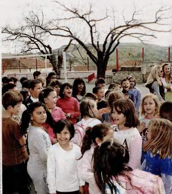
Στα 14.500 σχολεία της χώρας φέτος θα φοιτήσουν περίπου 1,5 εκατ. μαθητές και θα διδάξουν 156.000 εκπαιδευτικοί.

Το πρώτο κουδούνι μιας ιδιαίτερα κρίσιμης σχολικής χρονιάς θα χτυπήσει σήμερα στα 14.500 σχολεία της χώρας, στα οποία θα φοιτήσουν περίπου 1,5 εκατ. μαθητές και θα διδάξουν 156.000 εκπαιδευτικοί. Κατά τη διάρκεια της χρονιάς, το υπουργείο Παιδείας θα προχωρήσει στην αξιολόγηση των εκπαιδευτικών, ενώ θα γίνει ο προγραμματισμός για την αναδιανομή των οργανικών θέσεων στα σχολεία. Την ίδια στιγμή, οι εκπαιδευτικοί αντιδρούν στις περικοπές των απολαβών τους και τη δραματική μείωση των προσλήψεων. Ήδη, για αύριο προγραμματίζεται η πρώτη απεργία της χρονιάς, ενώ η ΟΛΜΕ και η ΔΟΕ κάνουν λόγο για 13.000 κενά. Από την πλευρά του, ο υπουργός Κων. Αρβανιτόπουλος, στη συνάντησή που είχε χθες με τα πρόεδρα των ΟΛΜΕ και ΔΟΕ, αναγνώρισε το δυσμενές περιβάλλον μέσα στο οποίο ξεκινά η σχολική χρονιά -«οι εκπαιδευτικοί δίνουν αγώνα να εκτελέσουν το καθήκον τους σε πολύ δύσκολες συνθήκες, με πενιχρά μέσα και μισθούς, οι οποίοι δεν είναι αντάξιοι του λειτουργήματος που επιτελούν»- είπε, αλλά εστίασε στις προσπάθειες που πρέπει να κάνουν όλοι προς όφελος των παιδιών. «Πρόκειται το εθνικό καθήκον, προέχει να σωθεί η χώρα και προέχει να θωρακισουμε το σχολείο. Παρά τις αντίξοες συνθήκες πρέπει όλοι να υπερβούμε τους εαυτούς μας γιατί αυτό που διακυβεύεται είναι πάρα πολύ σοβαρό, διακυβεύεται το μέλλον της πατρίδας, το μέλλον των παιδιών μας» τόνισε, προσθέτοντας ότι ήδη τα βιβλία έχουν φθάσει στα σχολεία, ενώ έχει καλυφθεί και το 80% των κενών θέσεων των εκπαιδευτικών. Ειδικό-