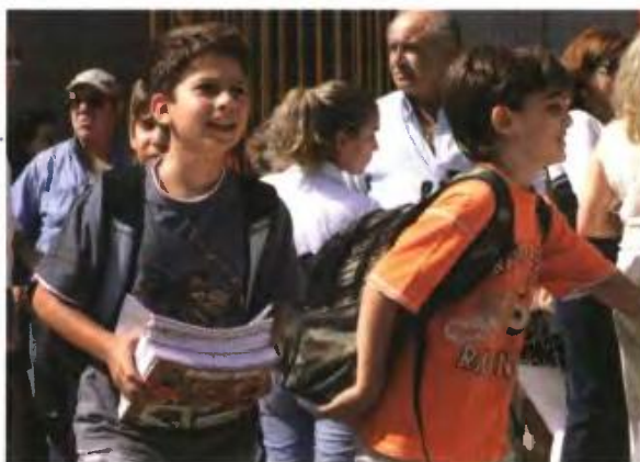
Με τα... βιβλία στο χέρι θα μείνουν οι μαθητές, αφού δάσκαλοι και καθηγητές αποφάσισαν κινητοποιήσεις με το «καλημέρα» της νέας σχολικής χρονιάς.