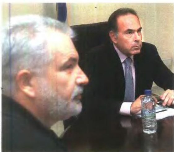
Ο υπουργός Παιδείας Κωνσταντίνος Αρβανιτόπουλος με τον πρόεδρο της ΔΟΕ Κομνηνό Μαντά, κατά τη διάρκεια της χθεσινής συνάντησης