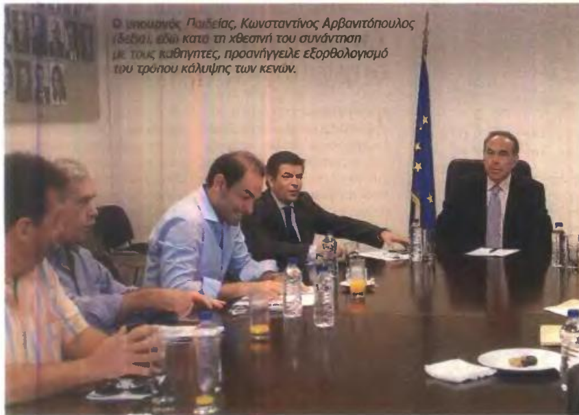
Ο υπουργός Παιδείας, Κωνσταντίνος Αρβανιτόπουλος (δεξιά), ενώ κατά τη χθεσινή του συνάντηση με τους καθηγητές, προσηγγείλε εξορθολογισμό του τρόπου κάλυψης των κενών.

[Δάσκαλοι-καθηγητές] Επαφές με το υπουργείο Παιδείας