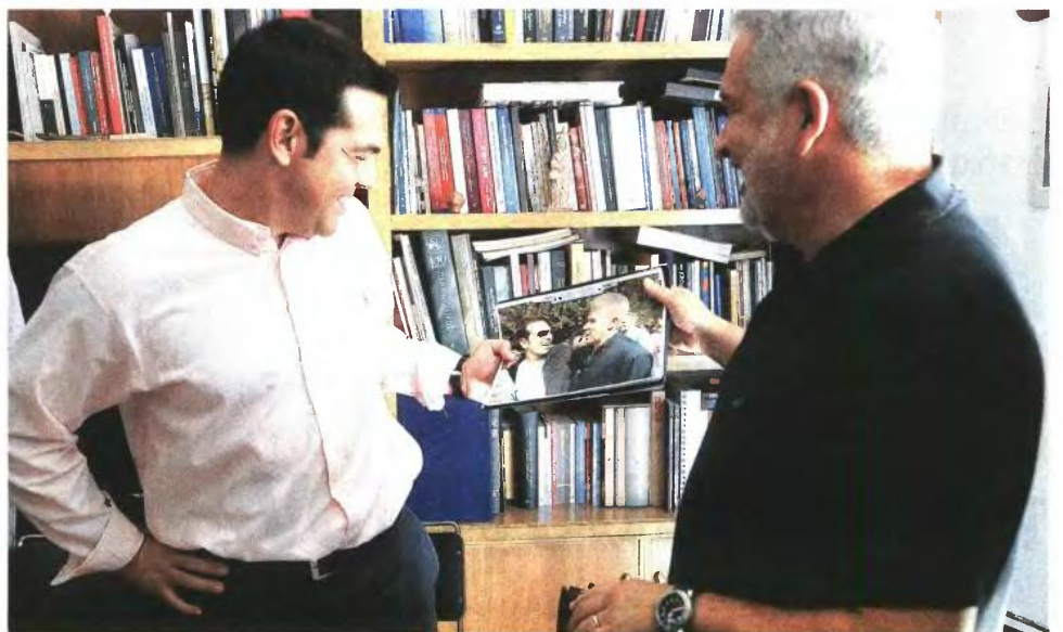
Ο επικεφαλής του ΣΥΡΙΖΑ Αλέξης Τσίπρας στη χθεσινή συνάντηση που είχε με το προεδρείο της ΔΟΕ χαμογελά Βλέποντας τη φωτογραφία που του δείχνει ο πρόεδρος της Διδασκαλικής Ομοσπονδίας Ελλάδας Κομνηνός Μαντάς και στην οποία απεικονίζονται οι δυο τους πριν από αρκετά χρόνια μάλλον