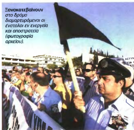
Ξανακατεβαίνουν στο δρόμο διαμαρτυρόμενοι οι ένστολοι εν ενεργεία και αποστρατεία (φωτογραφία αρχείου).

[μειώσεις μισθών] Αντιδρούν οι εργαζόμενοι