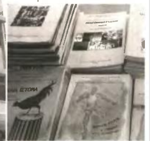
Το μόνο ενθαρρυντικό για φέτος είναι ότι τα βιβλία βρίσκονται ήδη στα σχολεία και περιμένουν τους μαθητές, όμως κανείς δεν γνωρίζει εάν και πότε θα εκταμιευθεί η δεύτερη δόση της κρατικής επιχορήγησης για την κάλυψη των λειτουργικών δαπανών