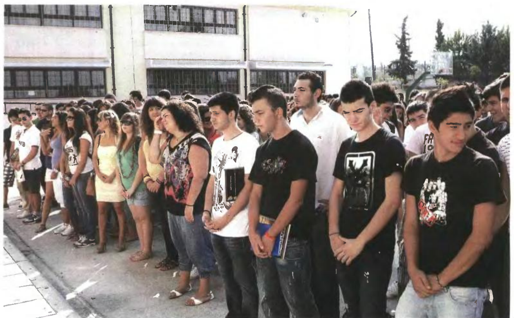
Με κενά αναμένεται να αρχίσει η σχολική χρονιά και στα γυμνάσια και τα λύκεια

«Βρισκόμαστε ελάχιστες μέρες πριν από την έναρξη του νέου σχολικού έτους και οι σχολικές μονάδες σε όλη τη χώρα θα κληθούν να αντιμετωπίσουν τα αυξημένα έξοδα που απαιτεί