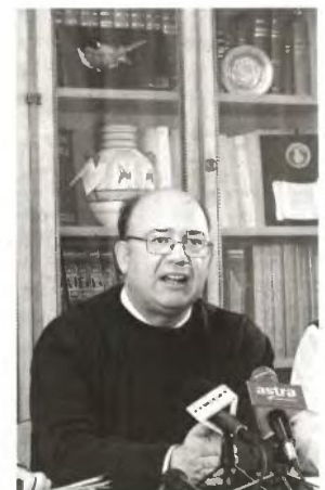
Ο πρόεδρος της ΟΛΜΕ, Νίκος Παπαχρήστος, τόνισε πως «φεύγουν από τα σχολεία βασικές ειδικότητες, δηλαδή μαθηματικοί, φυσικοί και φιλόλογοι, οι οποίοι έχουν και τις περισσότερες ώρες στην τάξη»

υπόγεια, αφού δεν έχουν λυθεί χρόνια προβλήματα σχολικής στέγης σε αρκετές περιοχές.