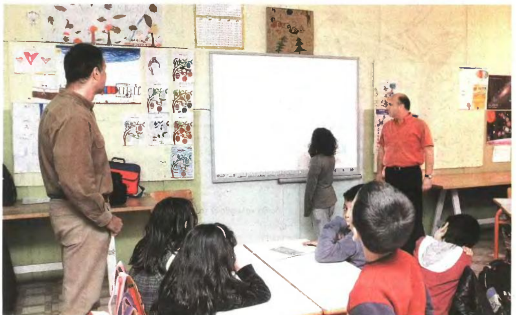
Μεγαλύτερα είναι τα κενά που καταγράφονται ήδη στα δημοτικά και στα νηπιαγωγεία όλης της χώρας