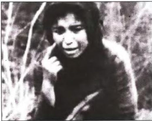
χέρια πολιτών τον αγώνα για υλική και ηθική δικαίωση της χώρας μας για τις ανθρώπινες απώλειες και τις υλικές ζημιές που υπέστη κατά τη διάρκεια της ναζιστικής κα-

Σας κοινοποιούμε το ψήφισμα της Γ.Σ. των Προέδρων των Ε.Λ.Μ.Ε. της χώρας σχετικά με την πρόσφατη απόφαση του Δικαστηρίου της Χάγης. Το ψήφισμα συντάχθηκε από την Α' ΕΛΜΕ Κορινθίας και υποβλήθηκε στη Γ.Σ. των Προέδρων με την στήριξη της Β' ΕΛΜΕ Κορινθίας και της ΕΛΜΕ Κορυδαλλού. Το ψήφισμα έχει ιδιαίτερη βαρύτητα λόγω του ότι ΟΛΜΕ εκπροσωπεί 100.000 εκπαιδευτικούς και αποκτά επίκαιρο χαρακτήρα λόγω της δανειακής σύμβασης υποτέλειας που επιβλήθηκε στη χώρα μας με την άμεση εμπλοκή της Γερμανίας της κας Μέρκελ. Το ψήφισμα έχει ως εξής: