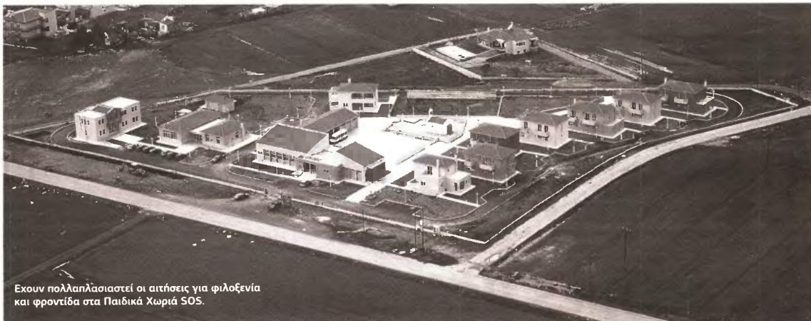
Έχουν πολλαπλασιαστεί οι αιτήσεις για φιλοξενία και φροντίδα στα Παιδικά Χωριά SOS.

Ανάλογη κατάσταση επικρατεί και στα δημοτικά σχολεία των Δήμων Νίκαιας - Ρέντη και Κερατσινίου - Δραπετσώνας, όπου προς το παρόν την καταγραφή αλλά και τη σίτιση των μικρών μαθητών έχουν αναλάβει ως ένα βαθμό οι δάσκαλοι και οι σύλλογοι γονέων και κηδεμόνων. ■