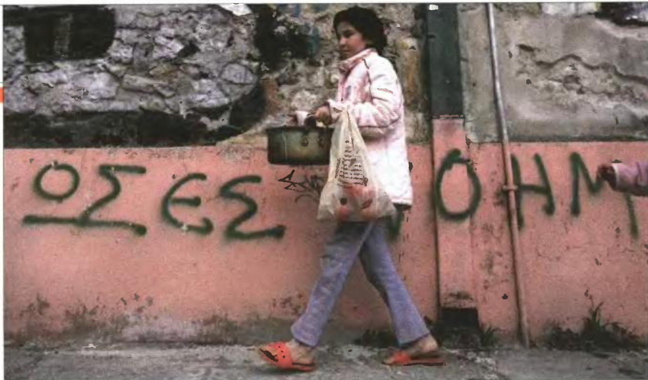
▲ Καθημερινές εικόνες με φτωχά παιδιά να παραλαμβάνουν συσσίτια