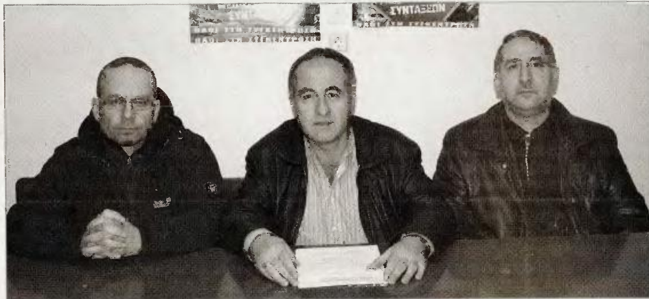
Από τη συνέντευξη Τύπου του ΝΤ Λάρισας της ΑΔΕΔΥ

Στην 24ωρη απεργία που προκήρυξαν για σήμερα ΓΣΕΕ και ΑΔΕΔΥ με αφορμή τις διαπραγματεύσεις για τη νέα δανειακή σύμβαση συμμετέχουν και οι δημόσιοι υπάλληλοι της Λάρισας με απόφαση του οικείου Νομαρχιακού Τμήματος της ΑΔΕΔΥ, καταλαμβάνοντας συμβολικά τα γραφεία του ΕΟΠΥΥ (πρώην ΟΠΑΔ στην οδό Νικηταρά) στις 11 το πρωί.