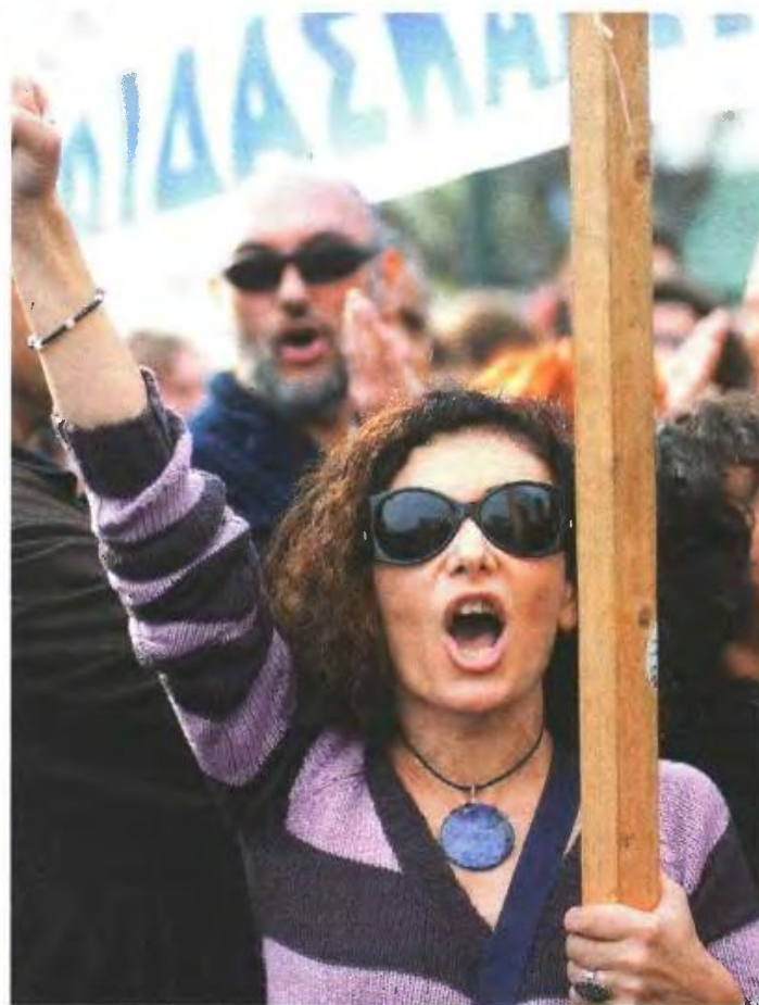
▲ ΟΙ ΕΚΠΑΙΔΕΥΤΙΚΟΙ προγραμματίζουν εκτός από πορείες και αποκλεισμούς δημοσίων κτιρίων

επέλαση της «τροϊκανής» πολιτικής. «Η ελλιπής χρηματοδότηση των σχολείων οδηγεί στην προμήθεια πετρελαίου και φυσικού αερίου με το σταγονόμετρο, με ένα μέρος των εξόδων να καλύπτονται από τους γονείς. Η ηγεσία του υπουργείου Παιδείας ετοιμάζει νέες συγχωνεύσεις και καταργήσεις σχολικών μονάδων μετά το πρώτο κύμα του περασμένου Μάρ-