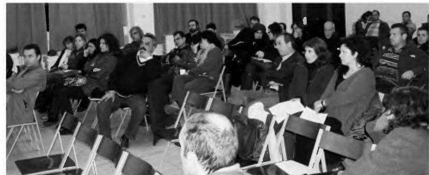
Από τη Γενική Συνέλευση της ΕΛΜΕ Χανίων που πραγματοποιήθηκε χθες βράδυ στο 5ο Γυμνάσιο, στη Ν. Χώρα.