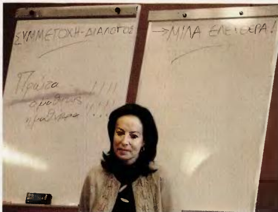
«Μίλα ελεύθερα», η προτροπή στον μαυροπίνακα με την υπουργό Παιδείας κ. Άννα Διαμαντοπούλου να συμμετέχει σε συζήτηση με μαθητές από το Γαλάτσι (12/12/2009).

Άρα, επίσημα, μεταβατικής φύσεως «πειραματόζωα» είναι οι μαθητές της φετινής Α΄ Λυκείου, εφόσον θέλουν να δώσουν εξετάσεις για την εισαγωγή τους στα ελ-