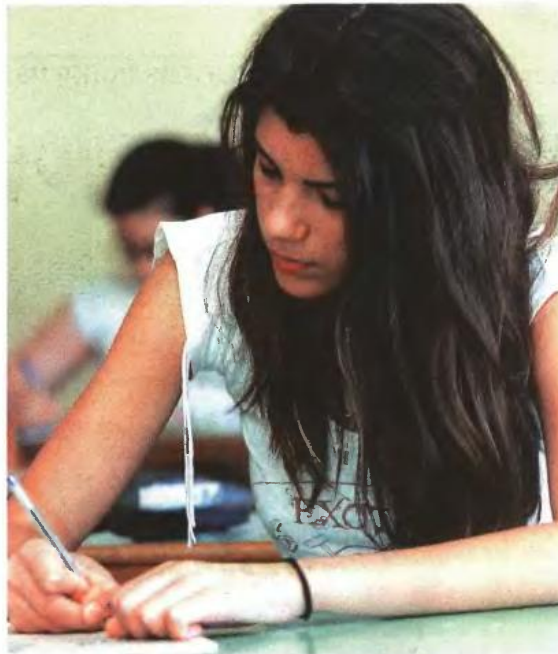
▲ ΜΕ ΑΓΩΝΙΑ αναμένουν οι μαθητές την οριστικοποίηση του νέου συστήματος εισαγωγής σε ΑΕΙ - ΤΕΙ

Από την πλευρά των κομμάτων της Αριστεράς, που δεν συμμετείχαν και στον διάλογο για τις αλλαγές στο λύκειο και το εξεταστικό σύστημα, επισημαίνεται ότι το νέο σύστημα συμβάλλει στην περαιτέρω εντατικοποίηση της εκπαιδευτικής διαδικασίας και καλλιεργεί τα αντανακλαστικά του ανταγωνισμού στους μαθητές. Ο Συνασπισμός σε ανακοίνωσή του τονίζει ότι με το νέο λύκειο τα παιδιά υποχρεώνονται από τη Β' τάξη να κάνουν κρίσιμες επιλογές για το μέλλον τους, ενώ το ΚΚΕ αναφέρει ότι «η στιγμή που η ανεργία των νέων θερίζει, μόνο ως πρόκληση μπορεί να εκληφθεί η δημαγωγία περί αποβολής του άγχους».