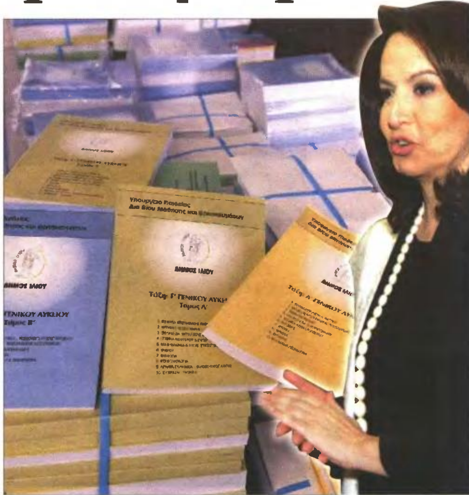
▲ Η υπουργός Παιδείας Άννα Διαμαντοπούλου